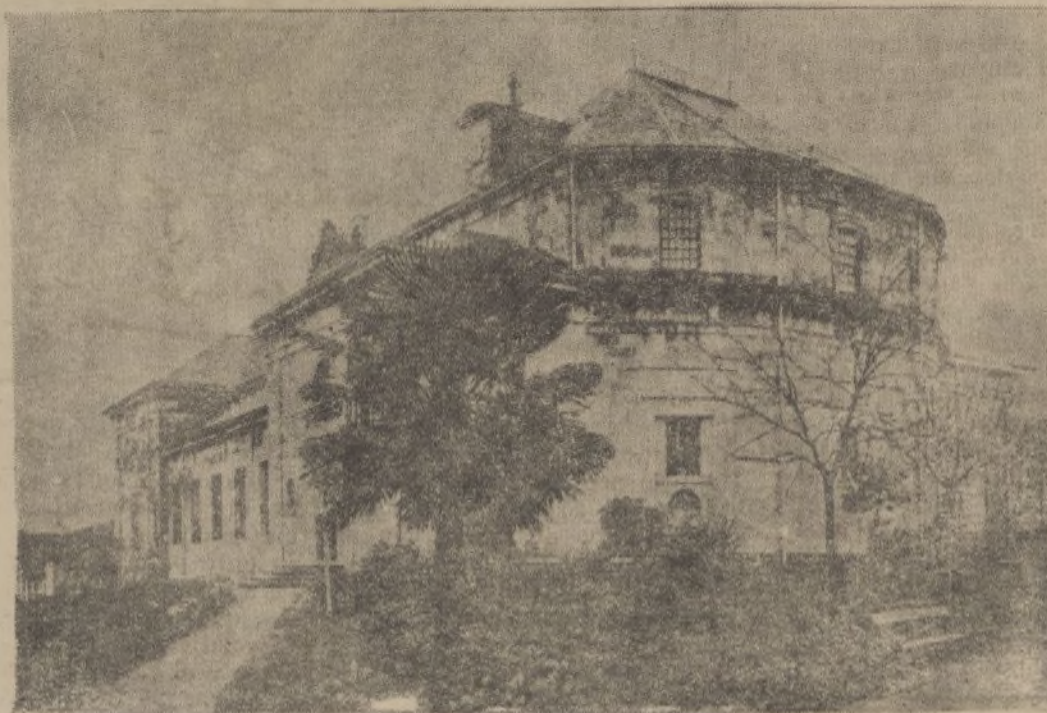
GUERNICA.—Casa de Juntas