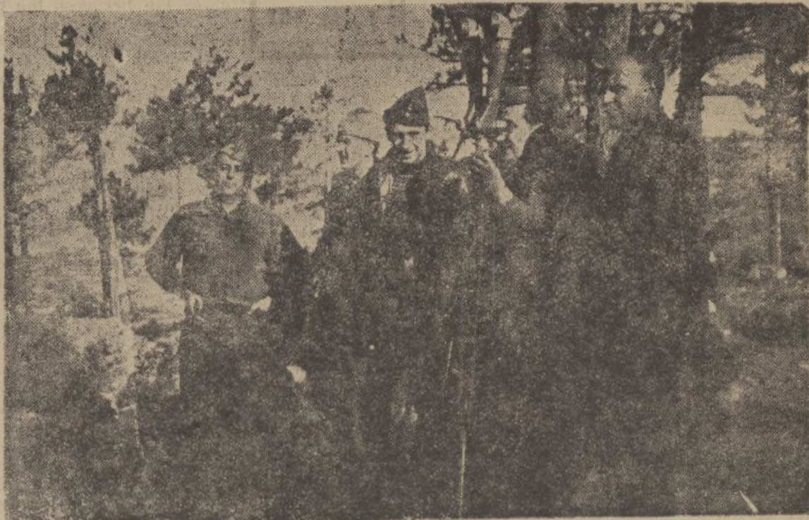
Observando los movimientos al enemigo