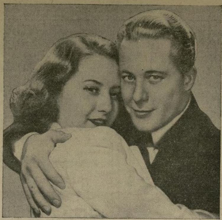
Barbara Stanwyck y Gene Raymond, protagonistas de la película "The Bride Walks Out", que empezará a presentar el Radio City Music Hall desde mañana jueves. Esta película es una comedia de la RKO.