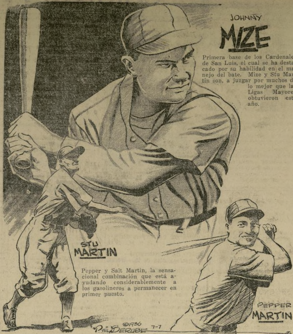
Pepper y Salt Martin, la sensacional combinación que está ayudando considerablemente a los gasolineros a permanecer en primer puesto.