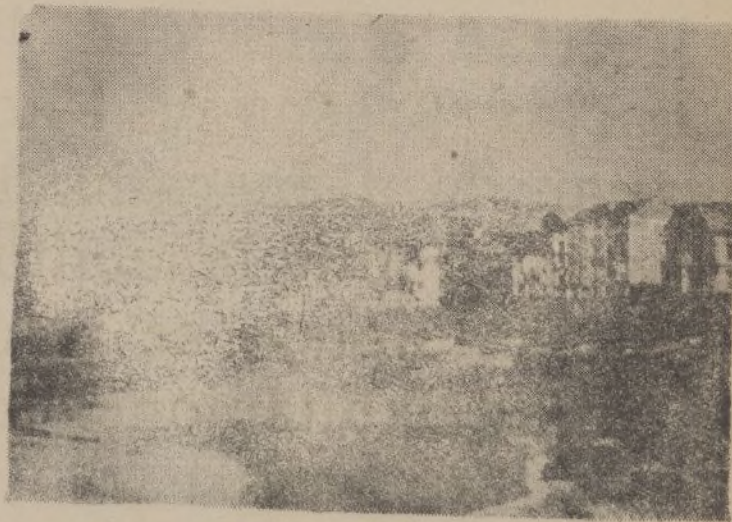
El Arza en bajamar: Sociedad Bermeana