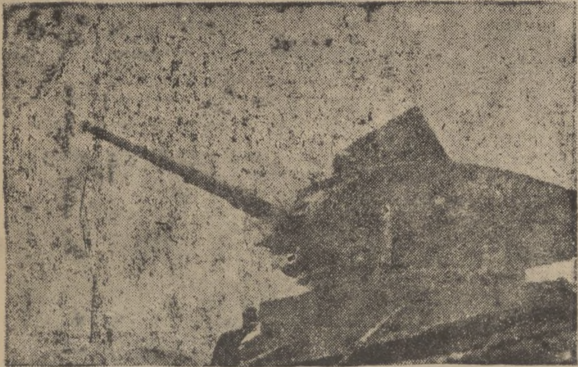
Tanque ruso arrebatado en el frente de Madrid, y ahora al servicio de las tropas del Generalísimo Franco.