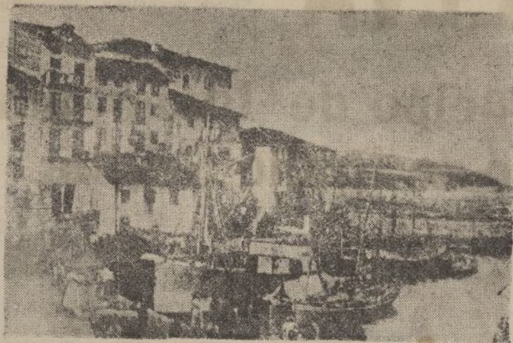
Muelle del Bocal: Detalle del puerto