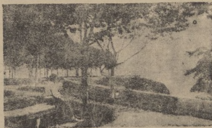
Atalaya e Izaro