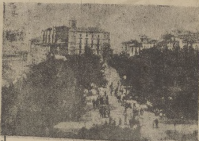
Parque de Ercilla