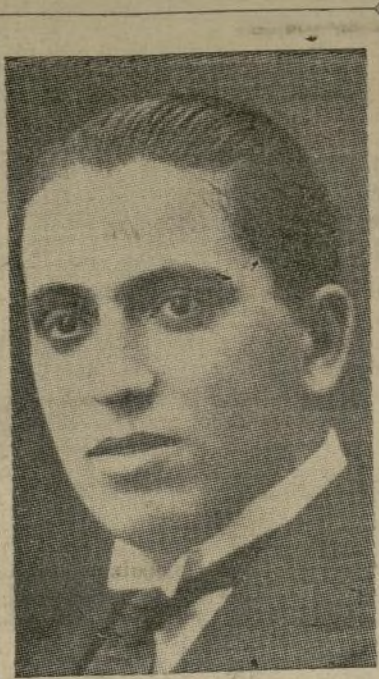
Don José Calvo Sotelo

La nave llevaba una tripulación de 23. Informes de Sabang, cerca de Palanan Point, decían que el "Marie" se había hundido cerca de la playa y que muchos miembros de la tripulación se habían ahogado.