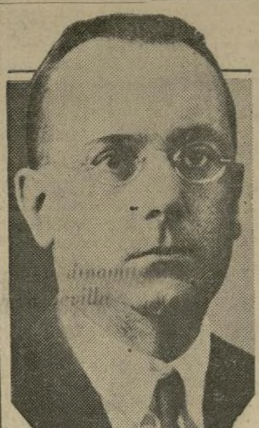
Don José Giral Pereira

Esta acogida aumentó aún más la fe y el entusiasmo del gran líder, y después de librar brillantes batallas en suelo granadino, organizó una expedición a su patria con la cual luchó hasta 1819, cuando, después de atravesar los Andes con grandes sufrimientos y sacrificios, se unió al gran patriota granadino Francisco de Paula, pero los patriotas granadinos