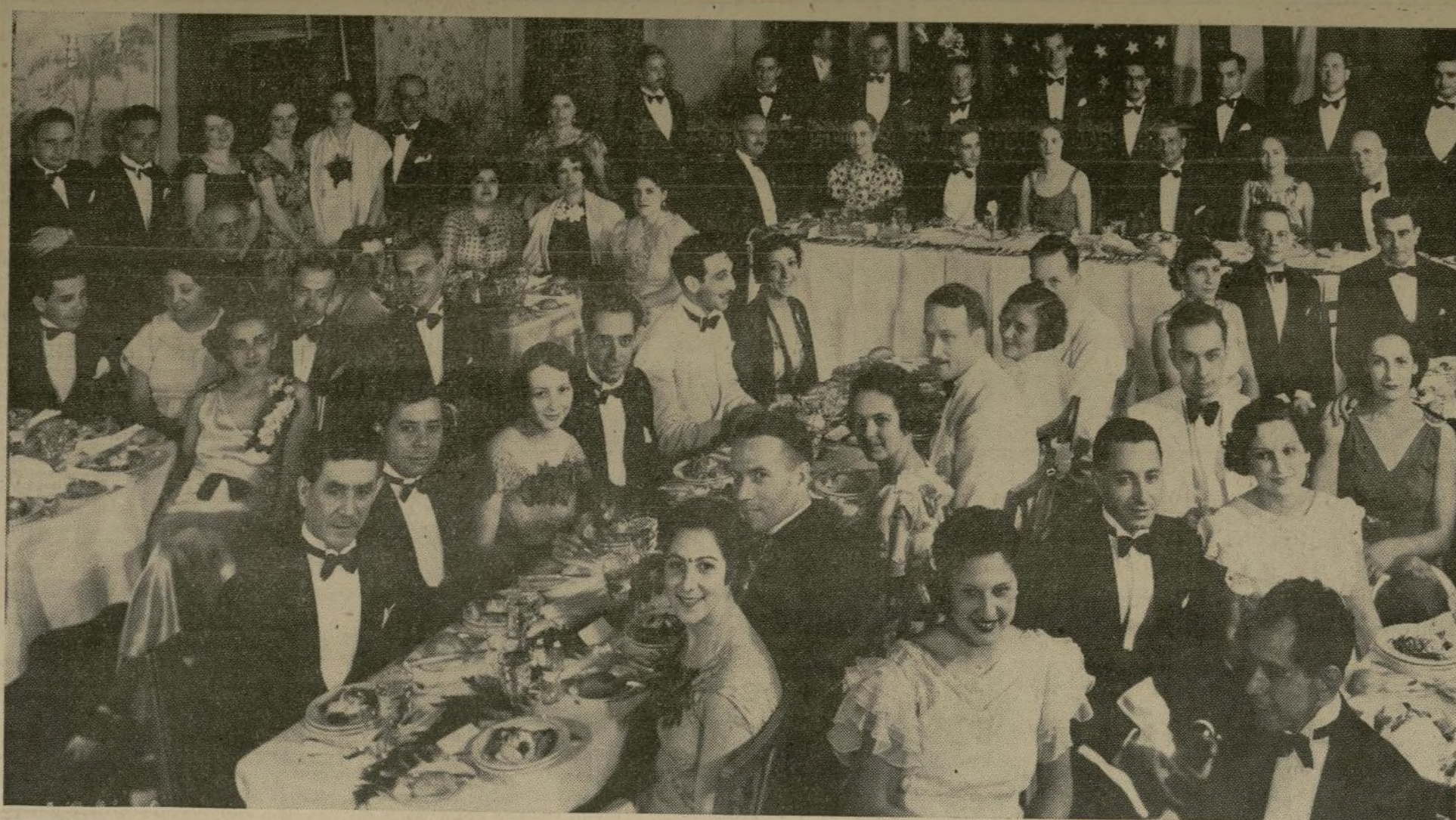
Organizado por el Centro Colombiano y bajo los auspicios del Consulado General de Colombia, tuvo lugar el sábado un elegante banquete-baile en la terraza del Hotel St. Moritz, al cual asistieron destacados miembros de la colonia colombiana de esta ciudad.