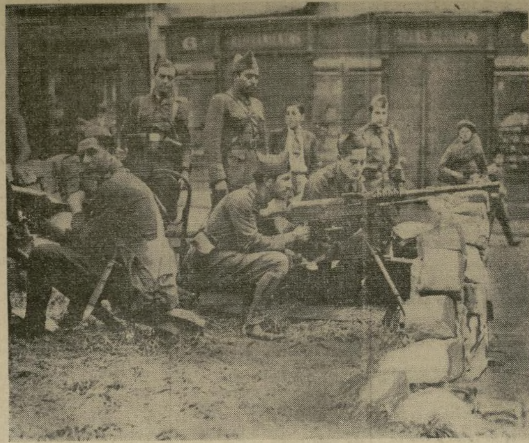
Esta escena tomada en una calle de Barcelona está repitiéndose actualmente en muchas ciudades de España, víctima de sangrienta guerra civil.

Alfonso desea sólo acabe el régimen de las izquierdas