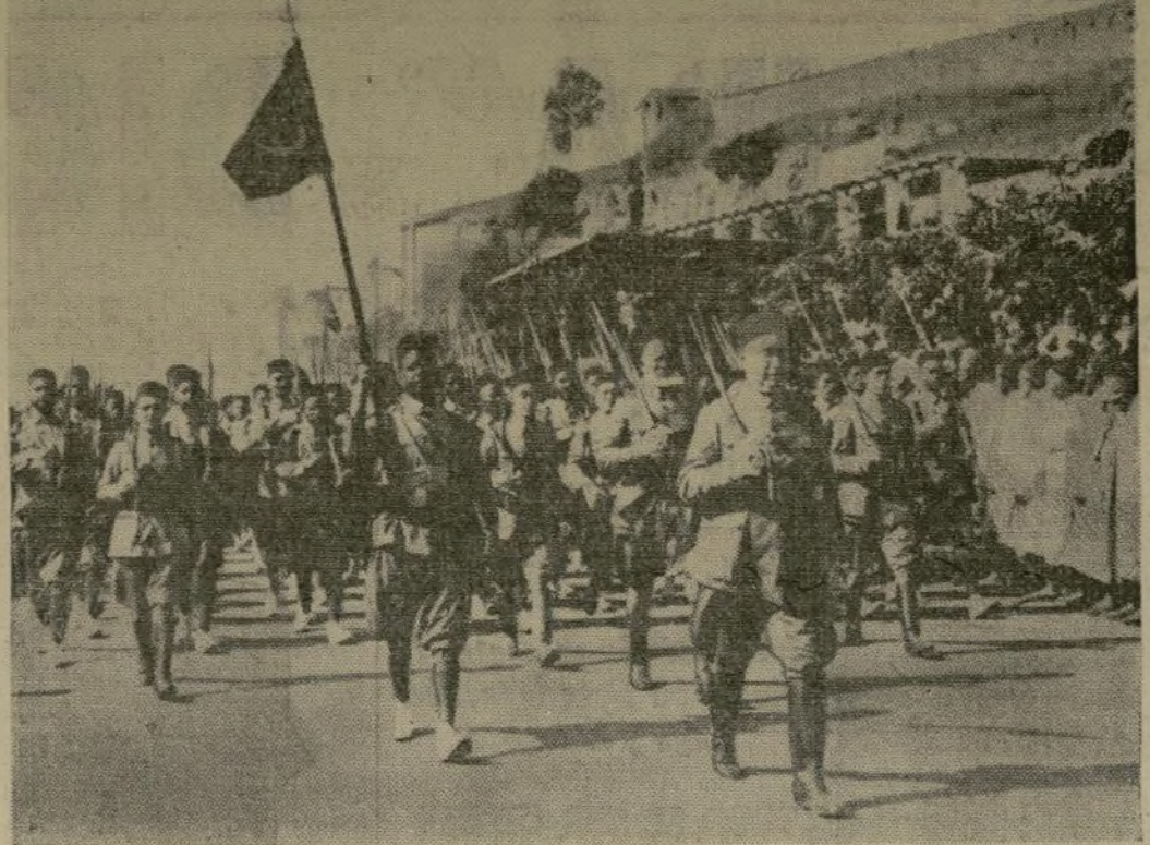
Soldados nativos de una guarnición de Marruecos que se han unido a las tropas rebeldes, del general Franco.