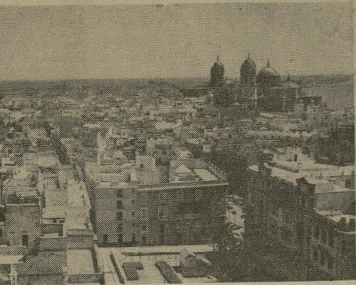
Una vista de la bella ciudad de Cádiz, en donde se dice han desembarcado tropas rebeldes, al mando del general Franco, procedentes de Marruecos.