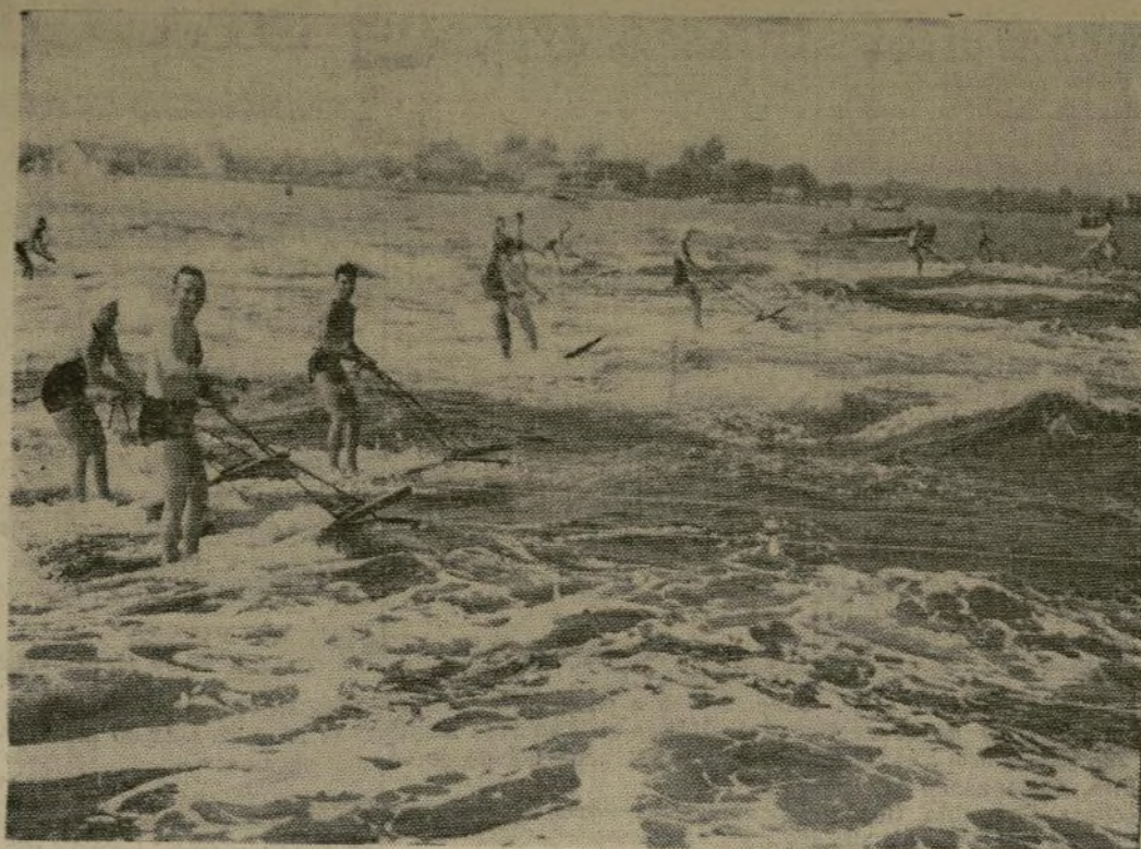
He aquí a un grupo de miembros del Nassau Shores Aquaplane Club de Amityville, Long Island, entregados a la práctica de su deporte predilecto. Se están preparando para los próximos campeonatos.