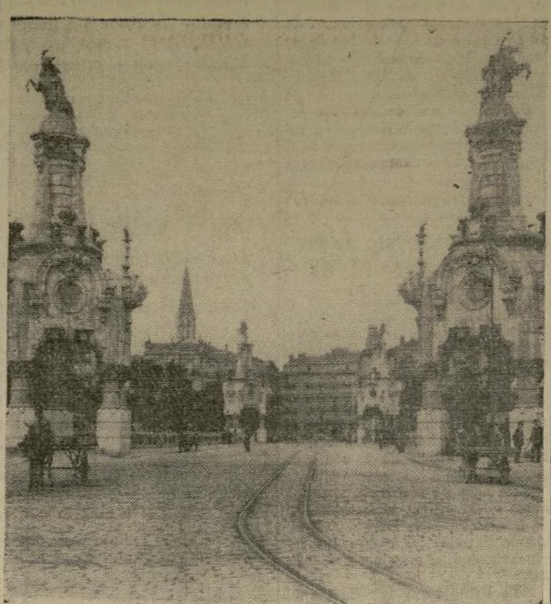
En esta ciudad, residencia veraniega de muchos diplomáticos, se han desarrollado sangrientos combates entre leales y rebeldes. Se dice que está en poder de estos últimos.

VISTA DE LA HERMOSA CIUDAD DE S. SEBASTIÁN