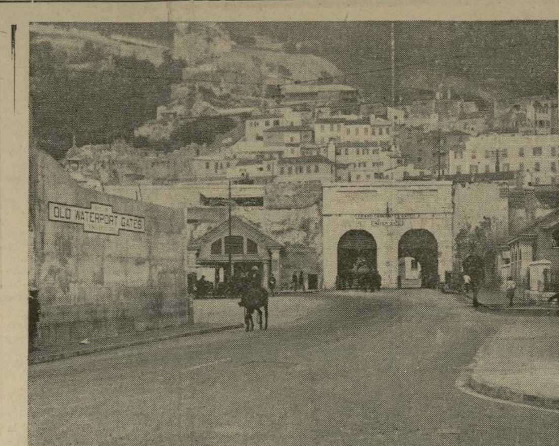
Miles de españoles se han refugiado en el Peñón huyendo a los horrores de la guerra civil, promovida por los generales.