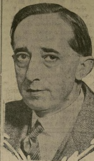
Embajador Claude G. Bowers

Comida española y criolla. Todos los deportes y diversiones. Baños, todas las comodidades. Baños, todas las comodidades.