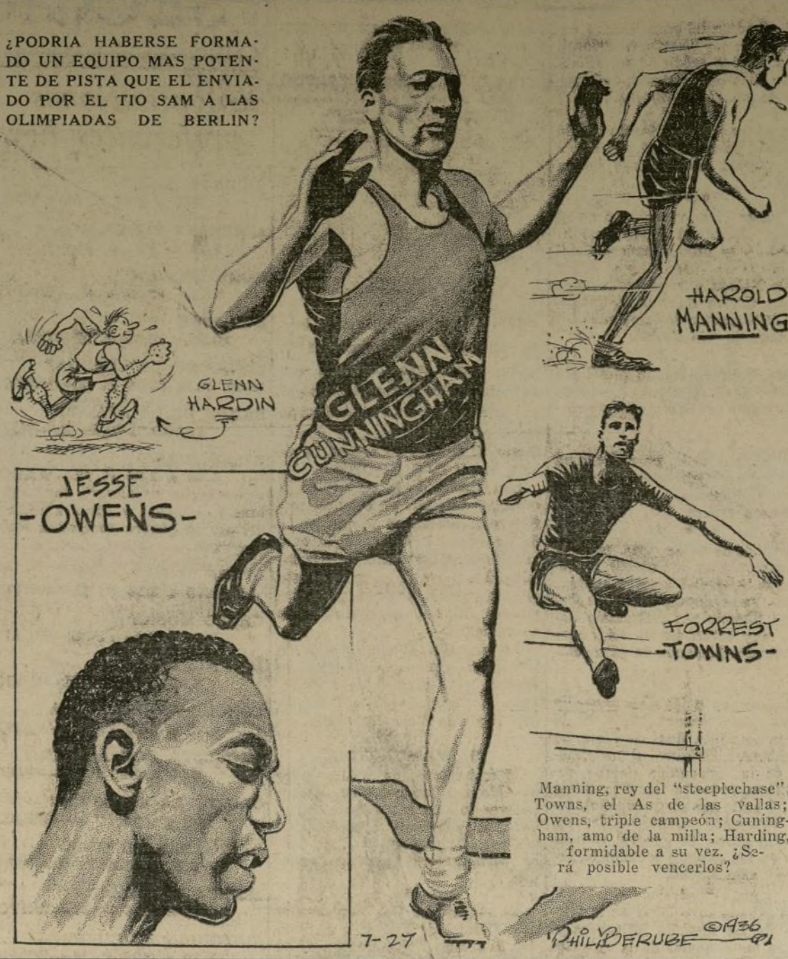
Manning, rey del "steeplechase"; Owens, triple campeón; Cunningham, amo de la milla; Harding, formidable a su vez. ¿Será posible vencerlos?

¿PODRIA HABERSE FORMADO UN EQUIPO MAS POTENTE DE PISTA QUE EL ENVIADO POR EL TIO SAM A LAS OLIMPIADAS DE BERLIN?