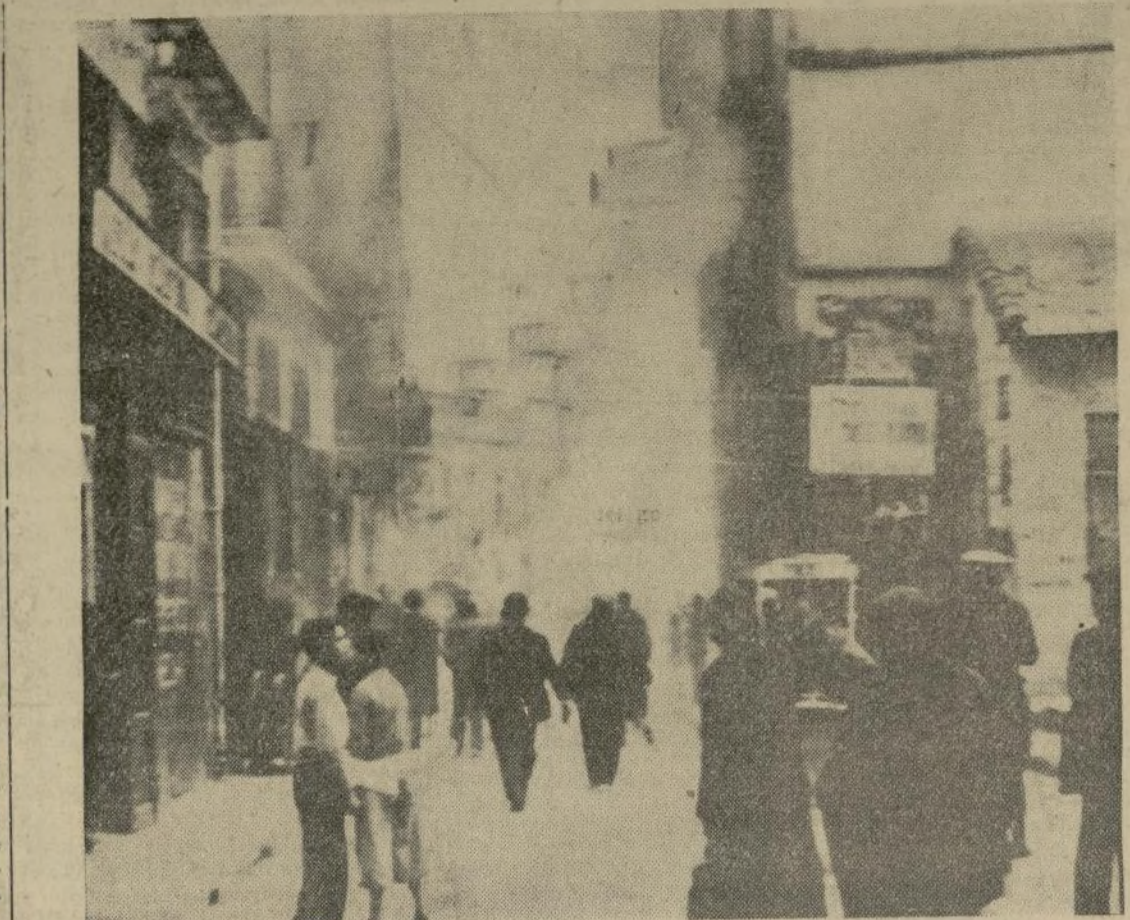
Una granada, explotando en la calle de Jesús, en Barcelona, en los comienzos de la lucha entre rebeldes y leales.

"La flota impide a los insurgentes reforzarse"—dice el jefe del gobierno