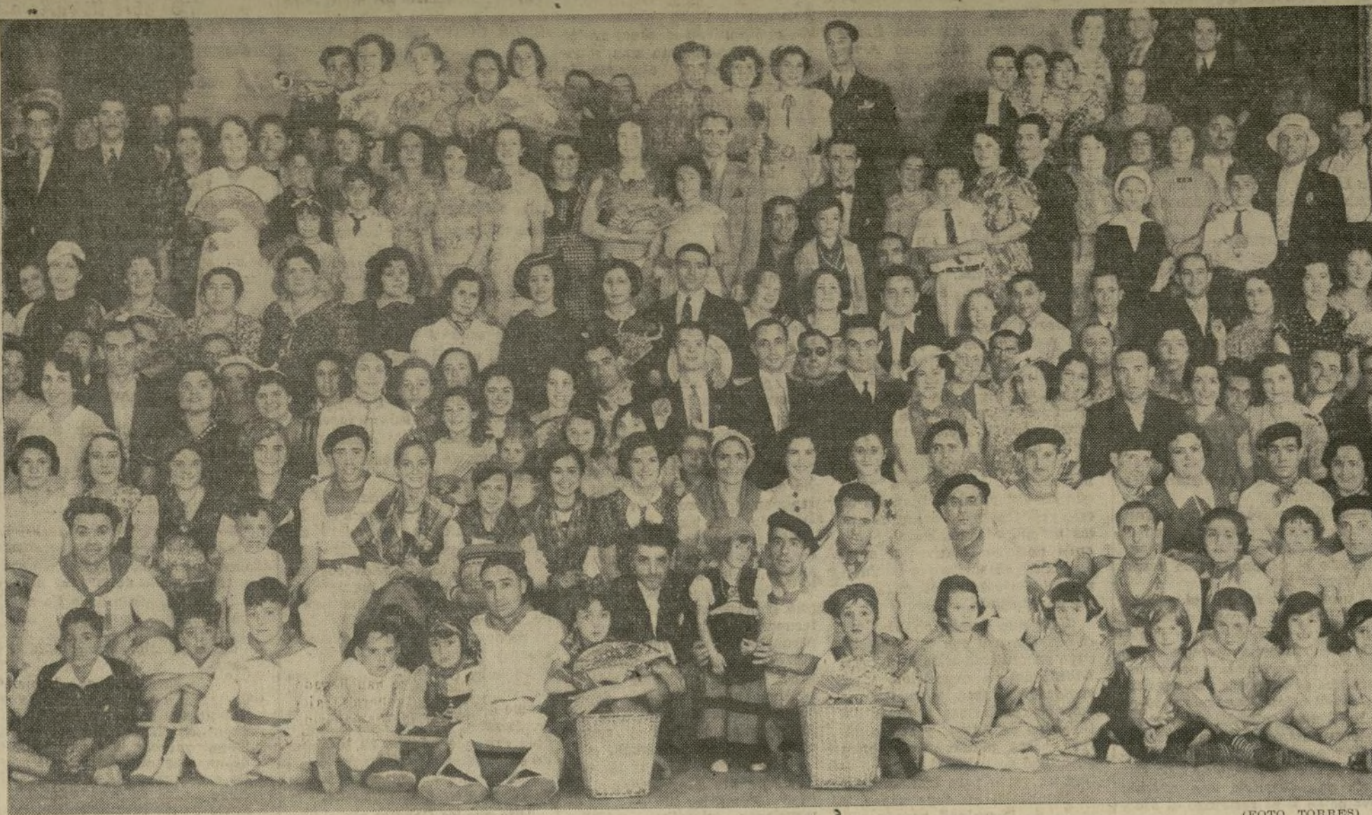
Parte de la lucida concurrencia que asistió a la verbena de este Centro, figurando en las primeras filas las damas y caballeros del Coro, y un grupo de niños con trajes típicos de la montaña santanderina.