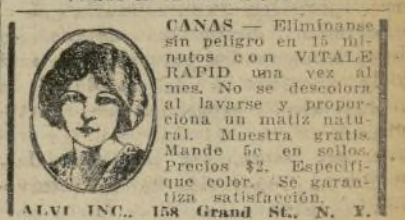
ALVA TSC, 158 Grand St., N. Y.

No hacía mucho que acababa de salir triunfante de la influencia de la guerra y el sitio económico, (Sigue en la octava página)