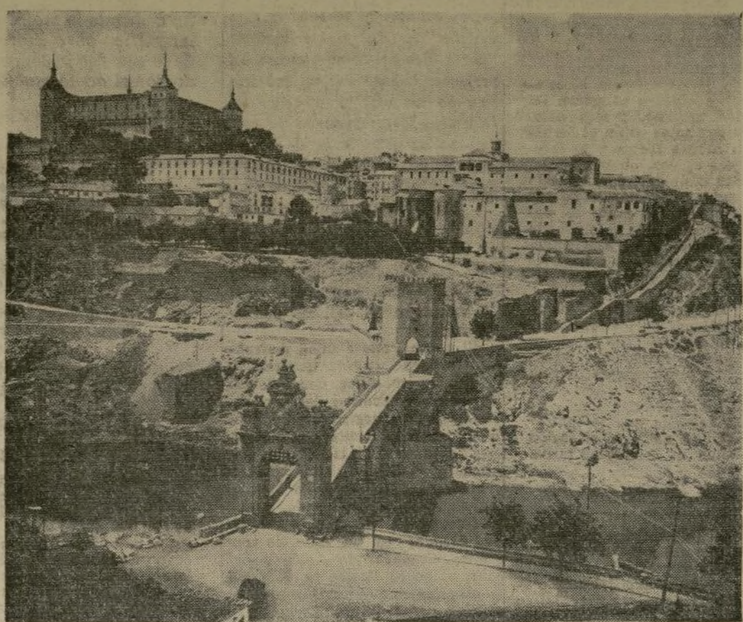
El Alcázar de Toledo, monumento nacional, atacado por tropas leales, con artillería y tanques por haberle tomado como refugio los rebeldes.