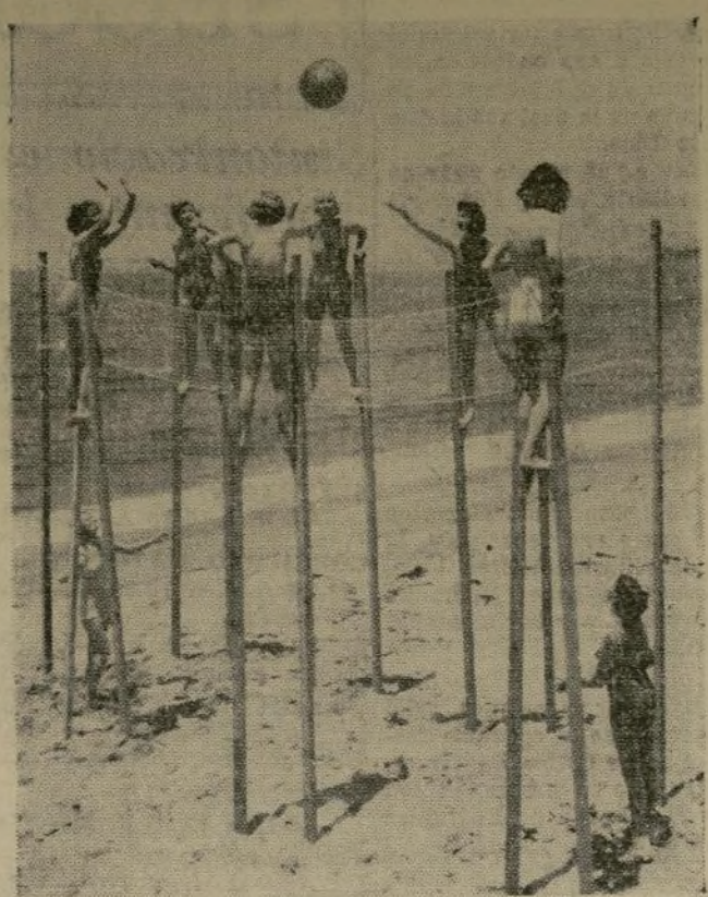
Un grupo de muchachas en la playa de Venice, California, jugando volley ball en zancos sobre la arena blanda en preparación para el torneo que será uno de los principales números del carnaval anual de cuatro días que empezará el 6 de agosto.