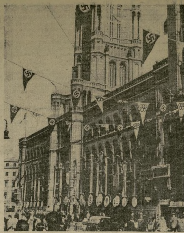
A la izquierda, la piscina al aire libre, situada al lado del gran Estadio. Al fondo puede verse la piletta de saltos de trampolín. Cerca de la piscina se halla un modernísimo gimnasio, así como el campo de balompié. A la derecha, Casa del Ayuntamiento en Berlín, engalanada para el recibimiento de las delegaciones de los diferentes países. Ante este edificio el alcalde ha dado la bienvenida a los diferentes equipos, entre imponentes y memorables ceremonias protocolarias.