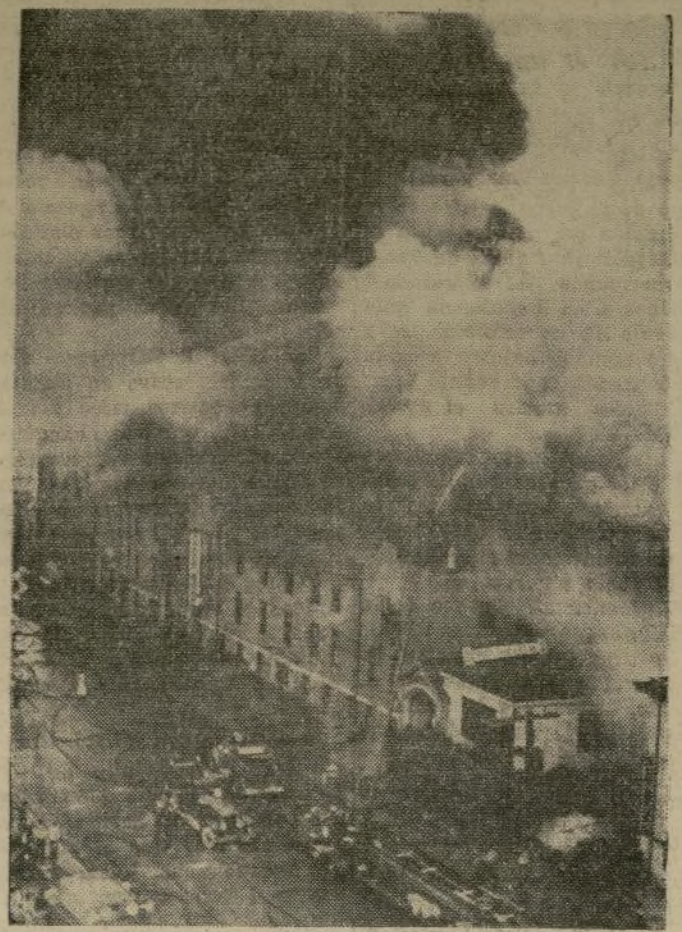
Enorme fuego se declaró anteayer en la sección comercial de Long Beach destruyendo casi un block de establecimientos. Varios bomberos resultaron heridos.