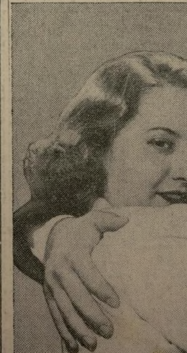
Barbara Stanwyck y Gene Raymond, protagonistas de la película "The Bride Walks Out", que se exhibe en el teatro Regent.

También se exhibe la producción "I Stand Condemned", con Harry Baur, Laurence Oliver y Penelope D. Ward. Esta cinta fué muy aplaudida cuando se presentó en la Avenida de las Luces.