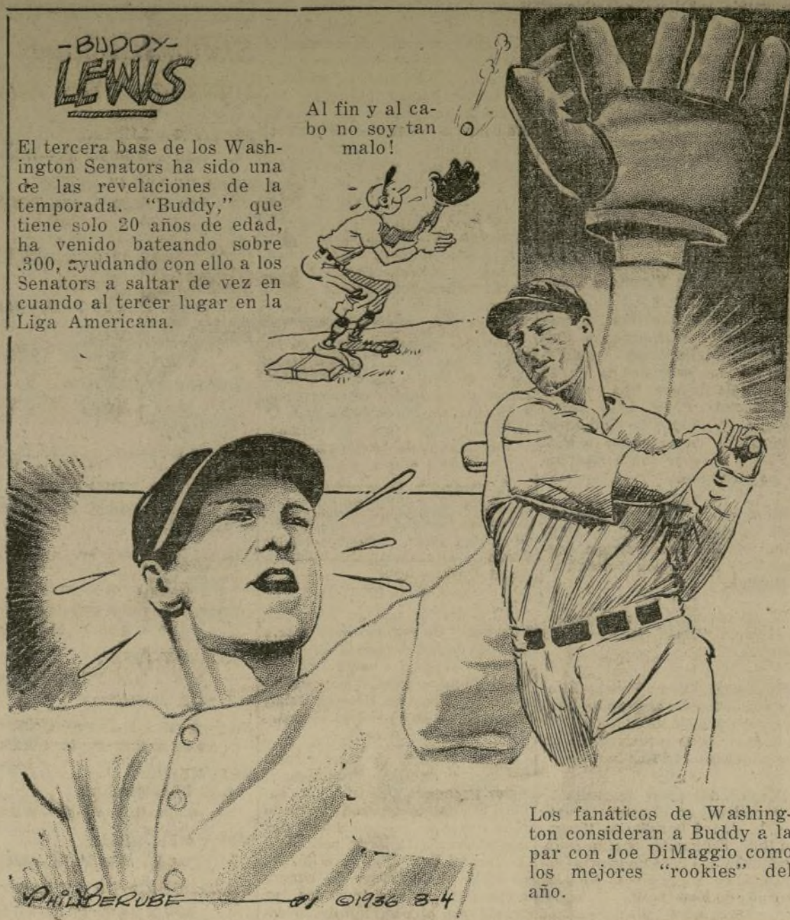
Los fanáticos de Washington consideran a Buddy a la par con Joe Di Maggio como los mejores "rookies" del año.