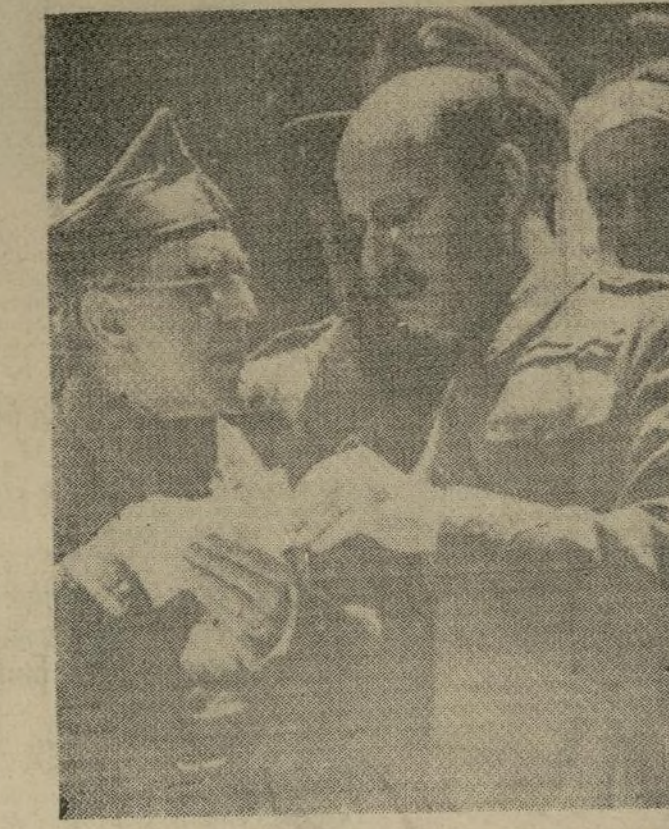
El ministro de la Guerra, general Costello, conferenciando con el general Riquelme, que está al cargo de la defensa del paso del Guadarrama. (El general Bernal ha sustituido a Riquelme, según cables de estos últimos días).