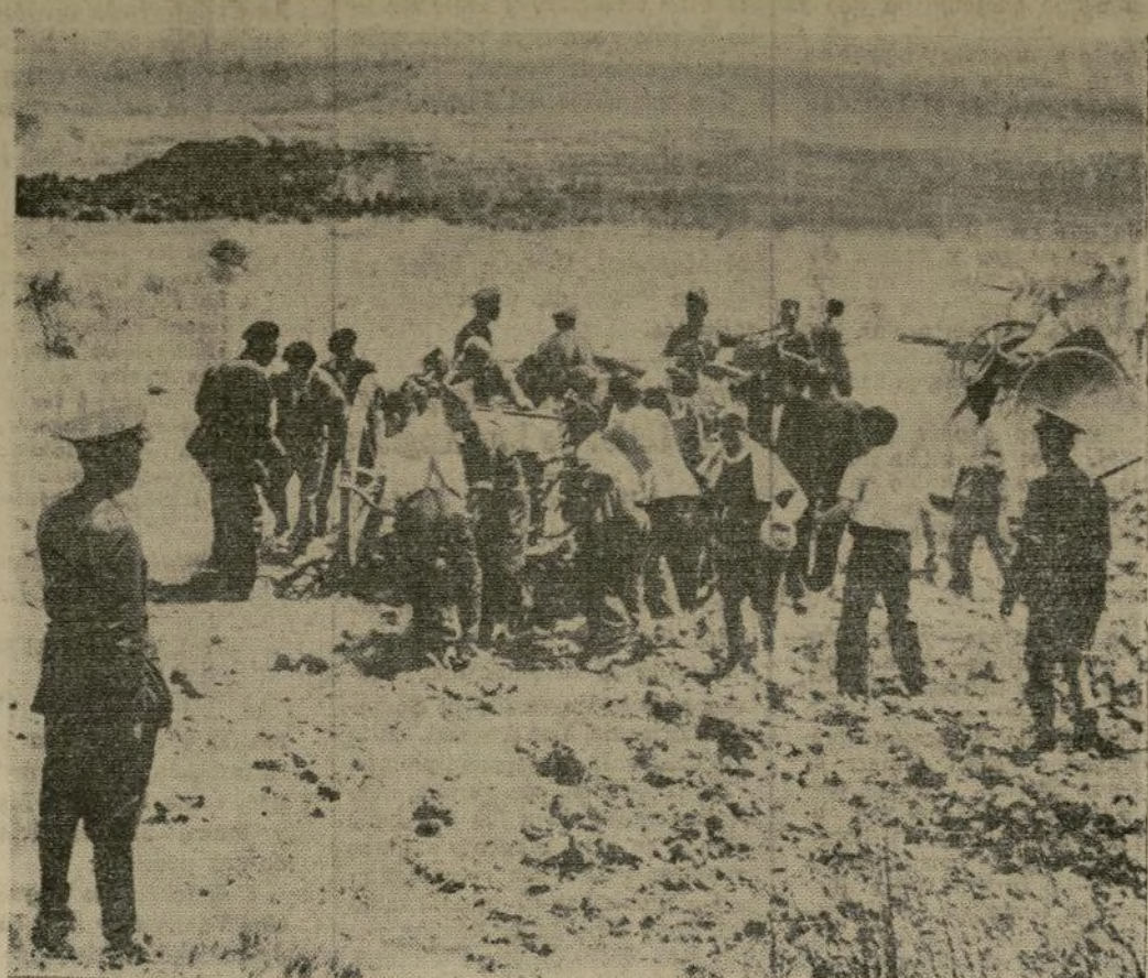
Soldados y oficiales leales, preparan las piezas de campaña para utilizarlas en la toma de Guadalajara. (Esta ciudad fué tomada por el Gobierno en los primeros días de la rebelión).