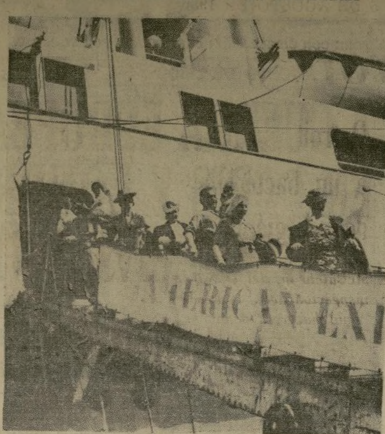
Ciudadanos norteamericanos que se encontraban en Barcelona al estallar la rebelión militar fueron llevados a Marsella por el transporte americano "Exeter."