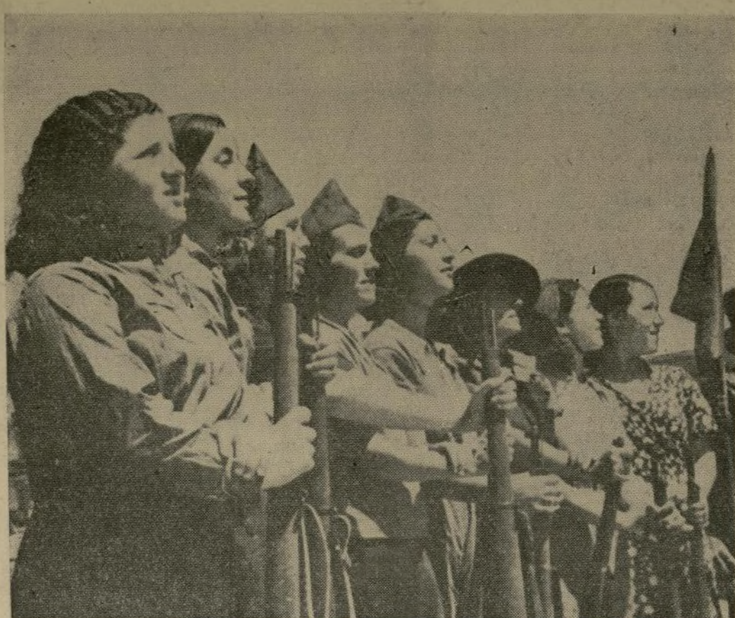
Una brigada de mujeres, guerrillas voluntarias, formadas para la inspección antes de partir a defender a Madrid contra el ataque rebelde.