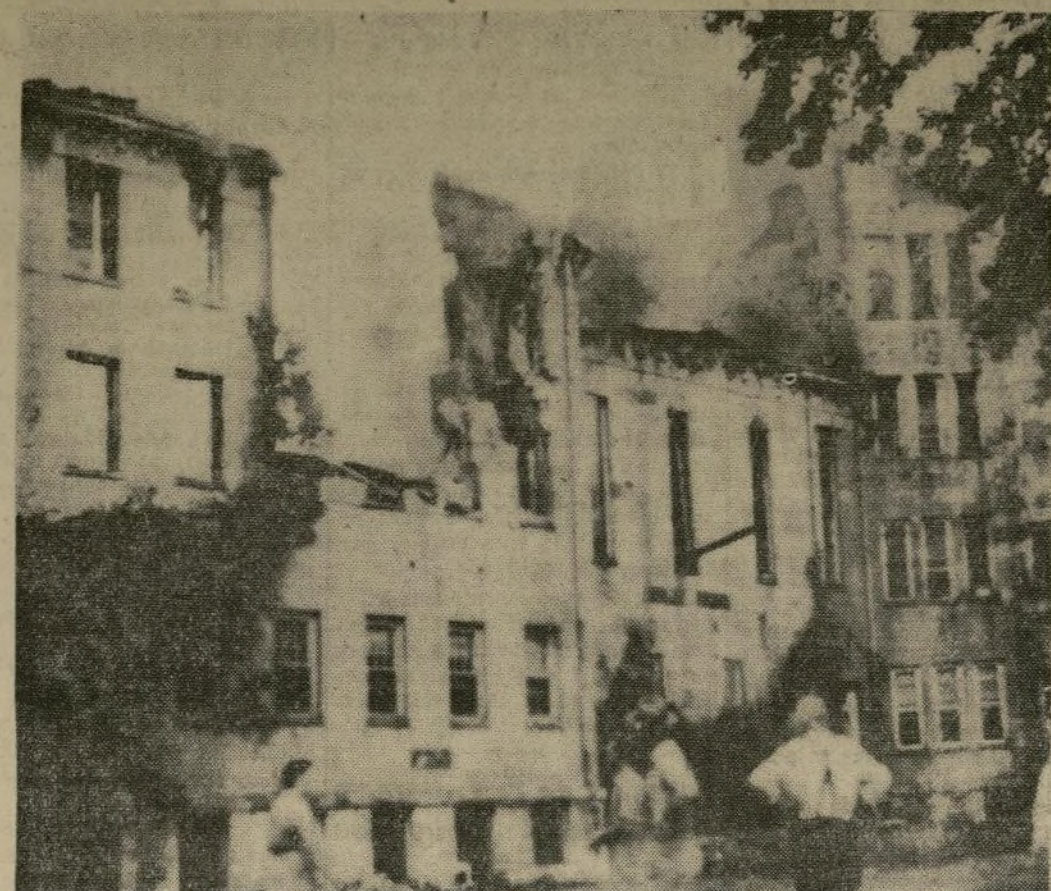
Sección central del Manicomico del Estado, en Mount Pleasant, Penn., que fué destruida por las llamas con pérdidas materiales de $400,000. Miembros del personal del Manicomico, residentes del pueblo y agricultores de la vecindad formaron un círculo de brazos para impedir que los dementes asilados escaparan.

A PESAR DEL FUEGO NO SE PERMITIÓ ESCAPAR A LOS LOCOS