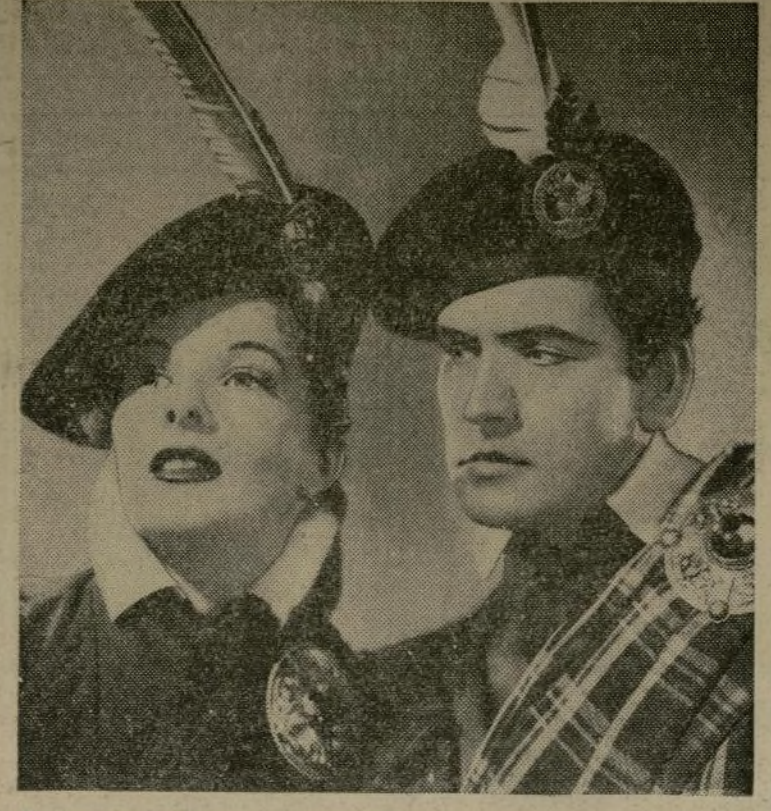
Katharine Hepburn y Frederic March, protagonistas de la película "Mary of Scotland" que retendrá por una tercera semana el Radio City Music Hall, debido a las muchas personas que han asistido a presenciar dicha producción.