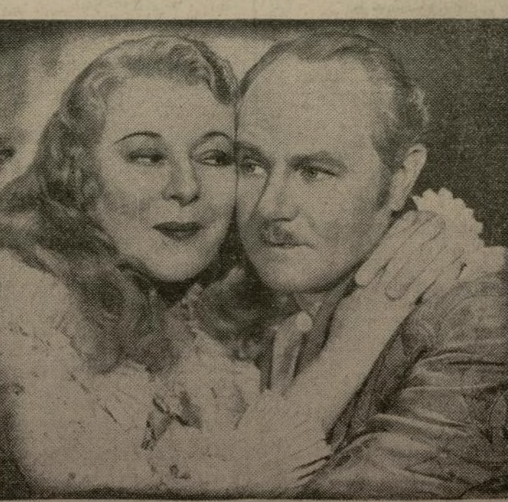
Mary Boland y Charles Ruggles, en una de las escenas de la comedia "Early to Bed" que presenta el teatro Loews de la calle 116. Es una película que tiene incidentes muy chistosos.