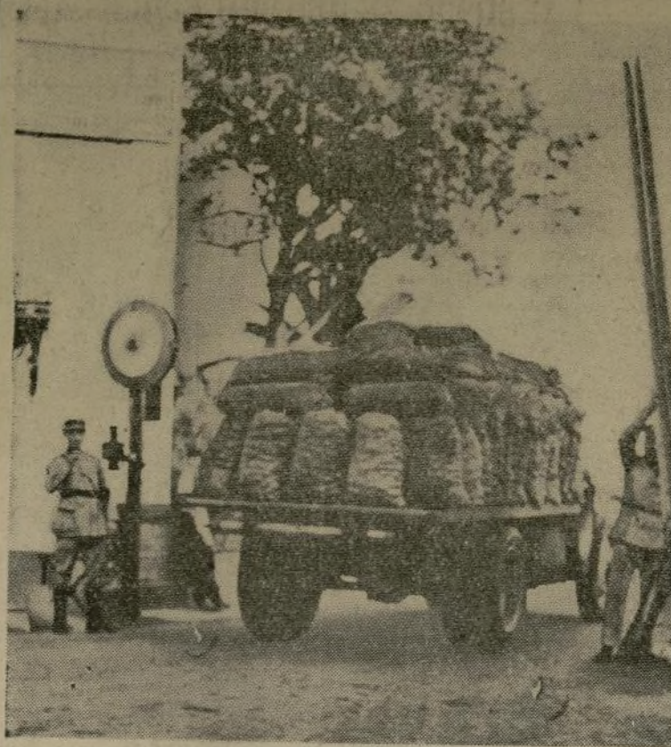
Un camión cargado de patatas pasando de Francia, por el puente de Behobia, con destino a las tropas del Gobierno.