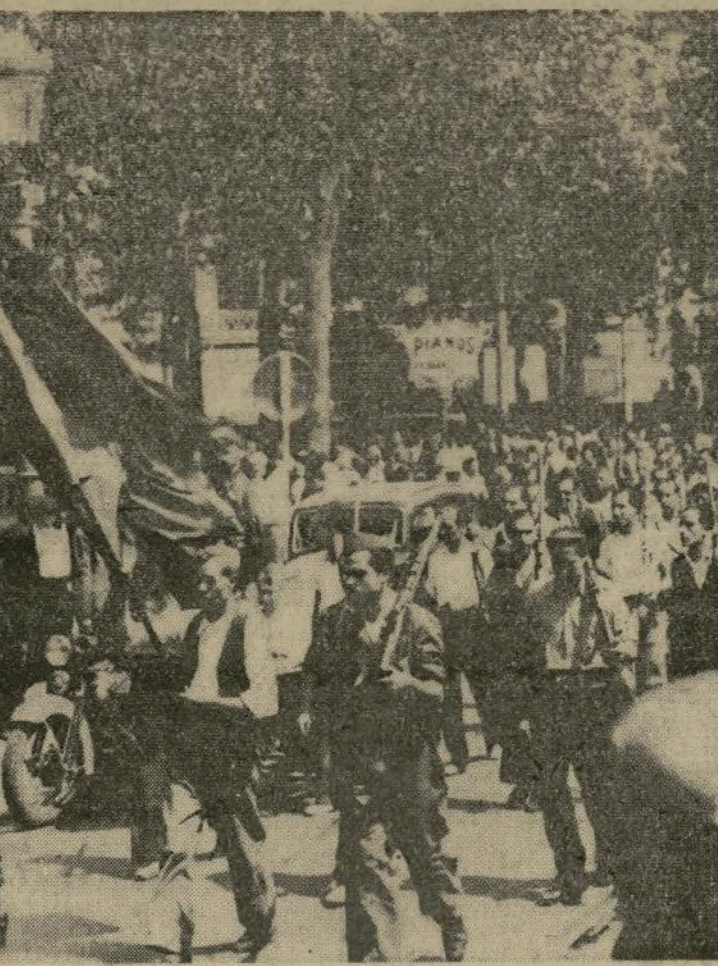
Milicianos adictos a la causa del Gobierno, dejando la ciudad para dirigirse hacia la plaza rebelde de Zaragoza.