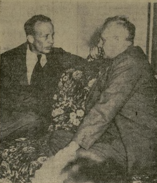
El Col. Theodore Roosevelt (izq.) hablando con el gobernador Al. M. Landon, candidato presidencial por el partido Republicano, en una de las conferencias celebradas por el gobernador de Kansas en el estado de Nueva York sobre la situación política. El gobernador Landon siguió al padre del Col. Roosevelt cuando éste inició su campaña en 1912.