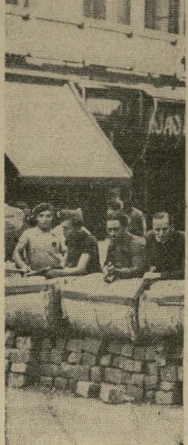
Miembros de las milicias gubernamentales detrás de una barricada construida en los comienzos de la rebelión.