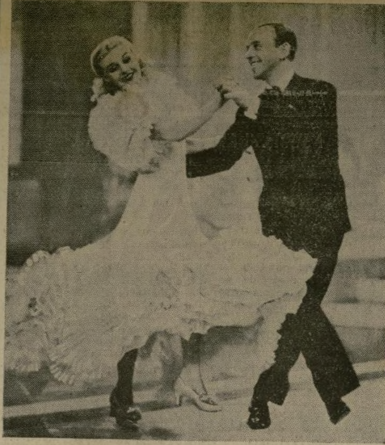
Ginger Rogers y Fred Astaire, célebre pareja de baile, quienes aparecen en la película "Swing Time" que se empieza a exhibir desde hoy en el Radio City Music Hall de esta ciudad.