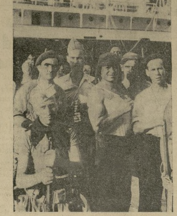
Milicianos voluntarios catalanes, en el puerto de Barcelona, preparados para salir a atacar a los rebeldes de Mallorca.