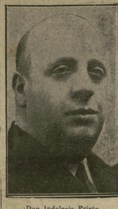
Don Indalecio Prieto