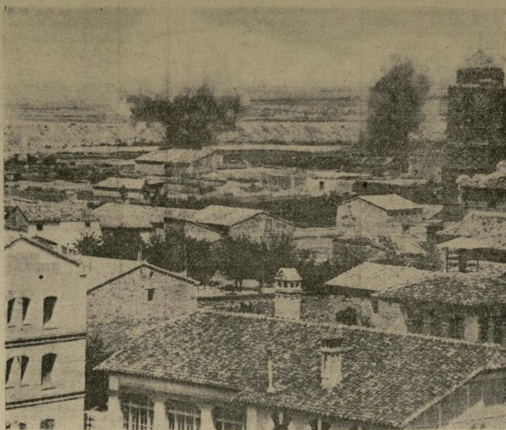
Granadas disparadas por cañones rebeldes, fotografiadas en el momento de estallar, contra la población de Tardienta, unos instantes antes de llegar el coronel Villalba con tropas leales que derrotaron a sus enemigos.