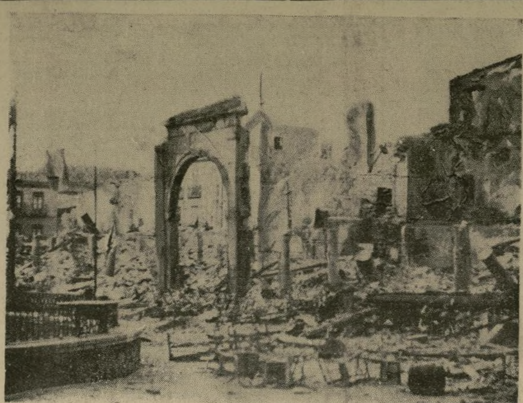
Plaza cercana al Alcázar de Toledo, después de un ataque aéreo de los rebeldes.