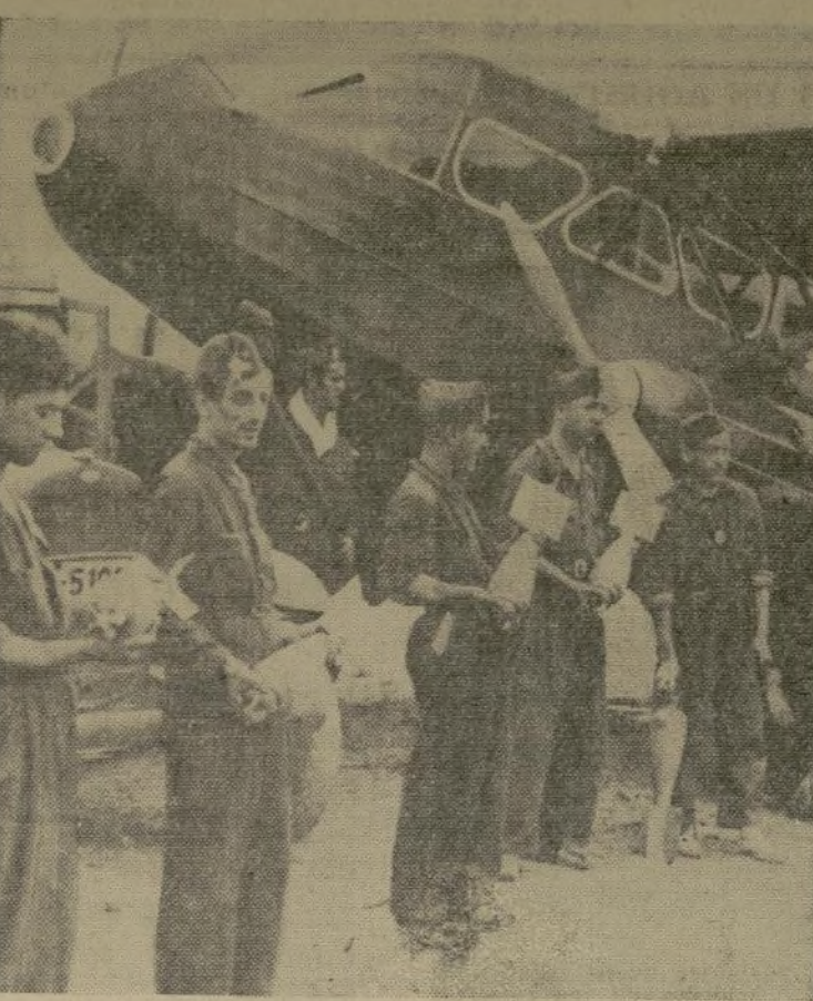
Soldados leales, en Aragón, cargando bombas en un aeroplano, para arrojárselas en las ciudades ocupadas por los rebeldes.