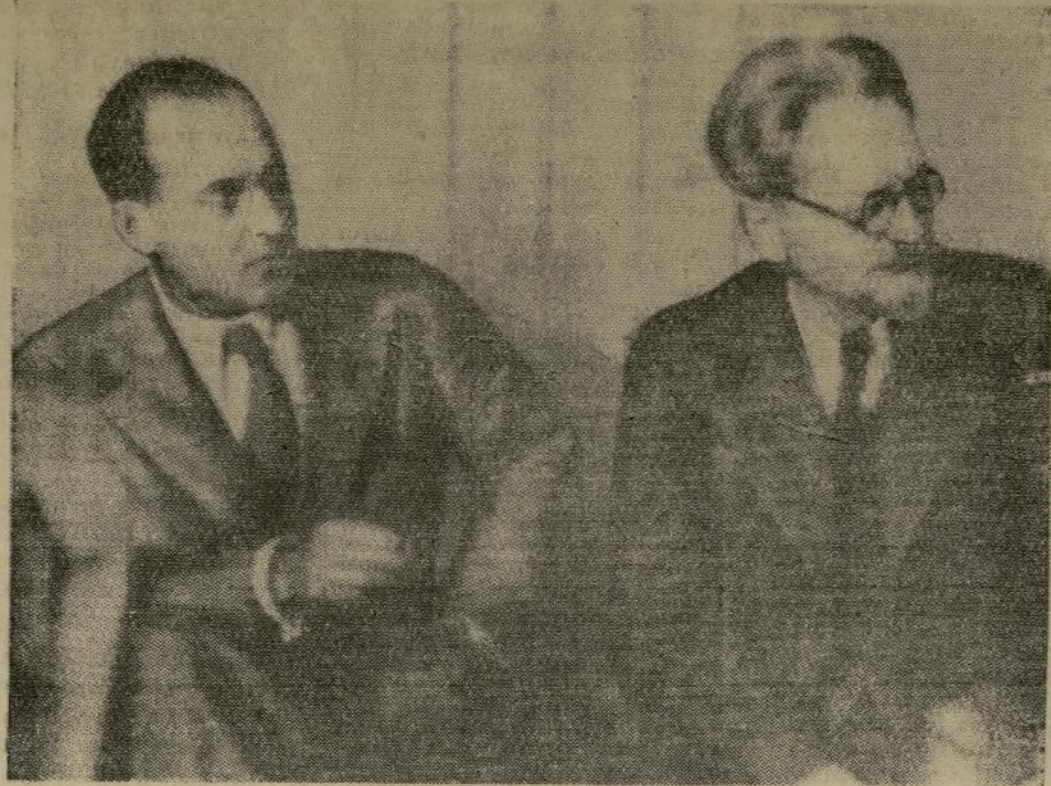
Radio fotografía en la cual se ve a León Trozky (derecha) y su secretario, Envin Wolff, en la investigación de la policía de Oslo, en la cual Trozky admitió que había estado "aconsejando" en su correspondencia a sus amigos revolucionarios en otros países. El Gobierno noruego ordenó que el desterrado fuera internado en su residencia de Hoenfos y su ayudante fué expulsado.

El premier noruego se opondrá a que expulsen a Trozky