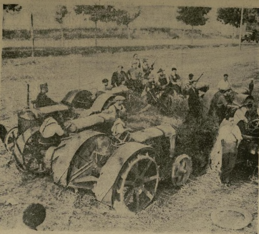
Tractores requisicionados por las tropas leales en las fincas de Aragón en donde debían ser empleados para la recogida de las cosechas.