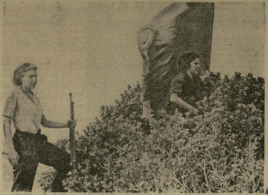
Una jefe de las mujeres voluntarias que se unieron a los expedicionarios que fueron a la conquista de las Baleares para el Gobierno, levanta la bandera en la cima de una colina en la Isla de Mallorca.

IZANDO LA BANDERA DE LA REPUBLICA ESPAÑOLA