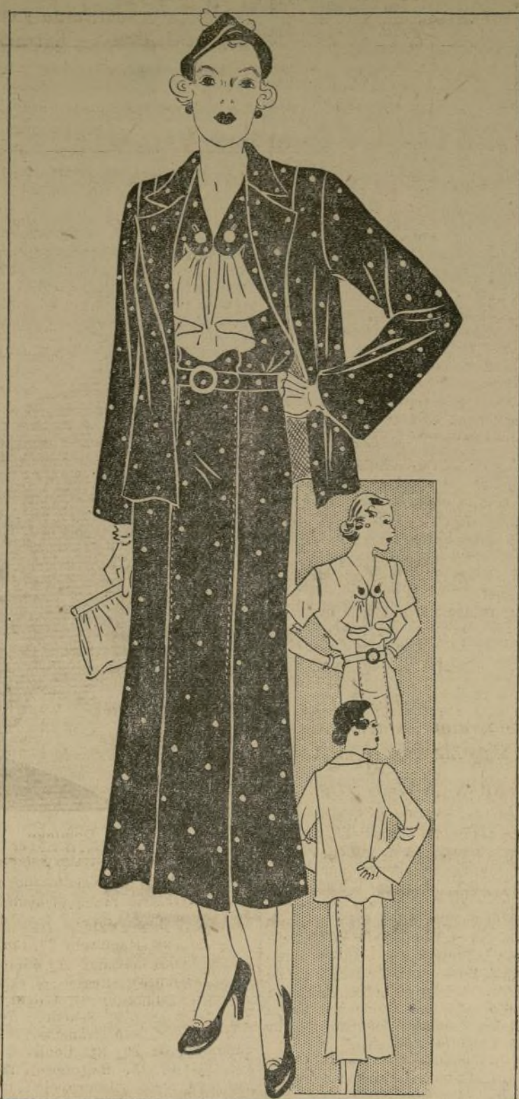
VESTIDO DE GABAN FACIL DE CONFECCIONAR PARA PERSONA GRUESA