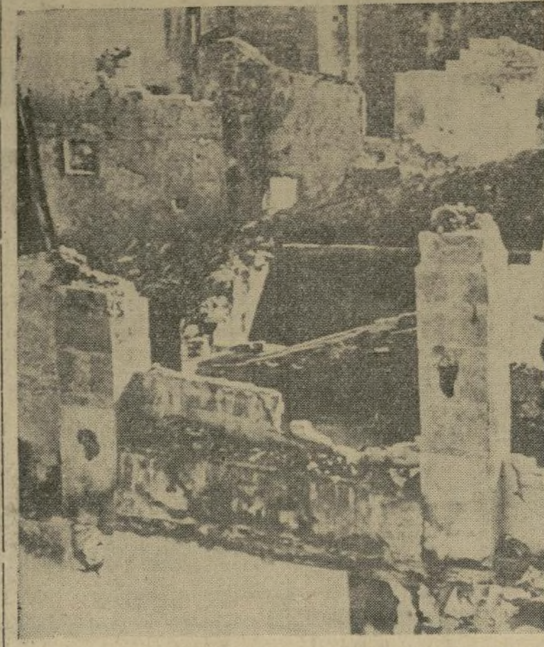
Estado en que han quedado las casas de la población de Sietana, en Aragón, después de un intenso bombardeo de la aviación rebelde.