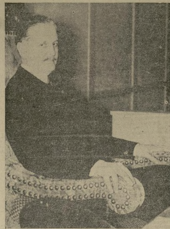
Dr. Carlos Saavedra Lamas, canciller argentino, que preside la Conferencia Interamericana de Paz en Buenos Aires.