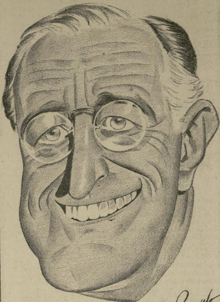
Caricatura del presidente, genial obra del ingenio y el talento del caricaturista peruano Sebastián Robles—hijo del gran compositor sudamericano Alomía Robles—única firmada por Mr. Roosevelt y publicada en la prensa de todos los Estados Unidos. El señor Robles es el único artista hispano cuyo nombre aparece en el "Who's Who" de 1936 y sus dibujos constituyen una de las más valiosas colaboraciones de varios de los grandes sindicatos periodísticos de este país.