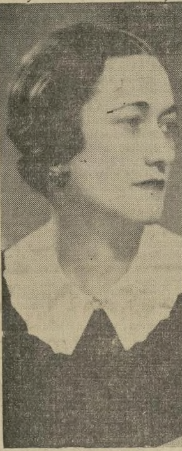
Mrs. Wallis Warfield Simpson, por cuyo amor abdicó Eduardo VIII al trono más poderoso del mundo.