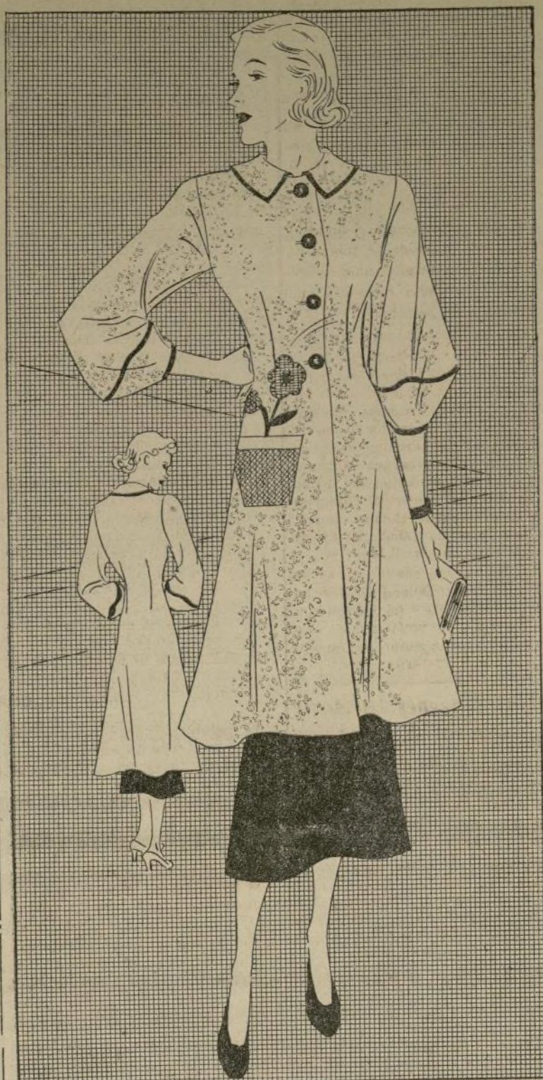
1210-B BLUSON PARA LA CASA CON UN TOQUE MUY DISTINGUIDO

Consulte siempre la SECCION DE CLASIFICADOS de LA PRENSA.