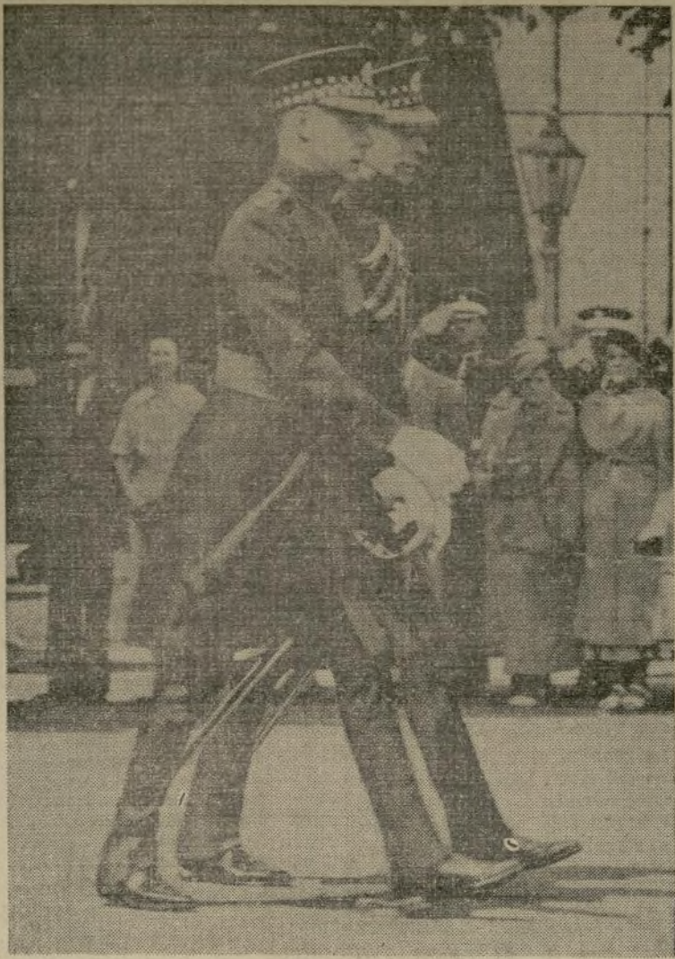
Su amor pudo más que un gran trono

EL REY QUE ABDICÓ Y SU SUCESOR Y HERMANO