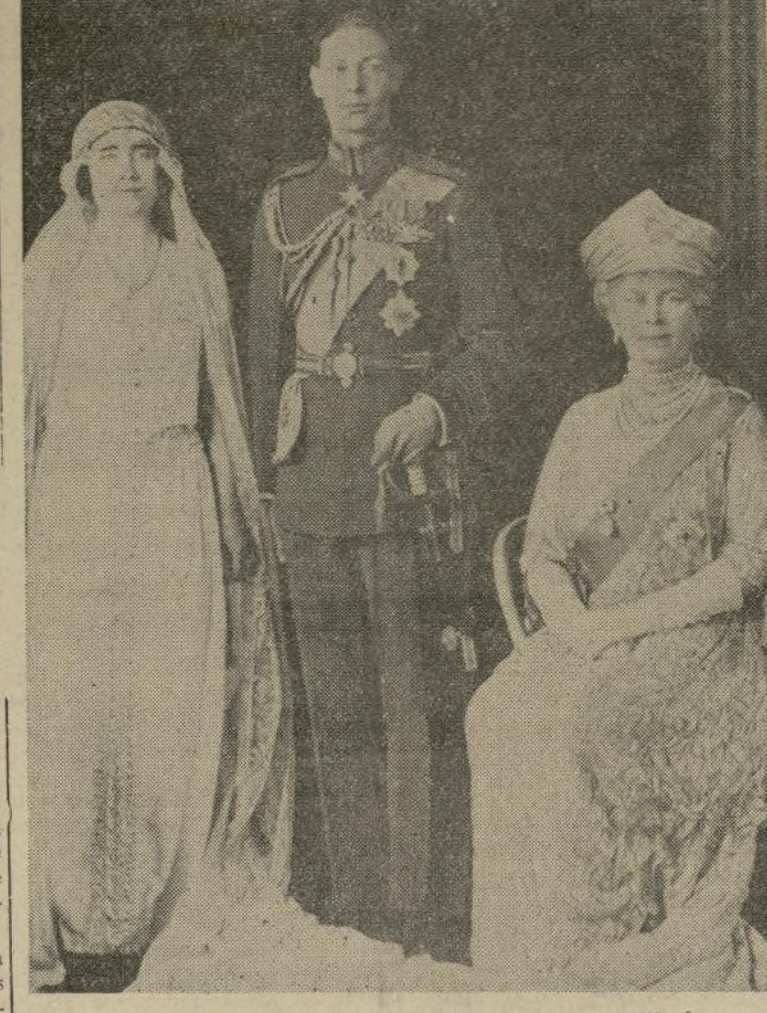
El nuevo monarca con su esposa y la reina madre María, a su regreso al Palacio de Buckingham después de su matrimonio en la Abadía de Westminster.

EL NUEVO REY, SU ESPOSA Y LA REINA MADRE