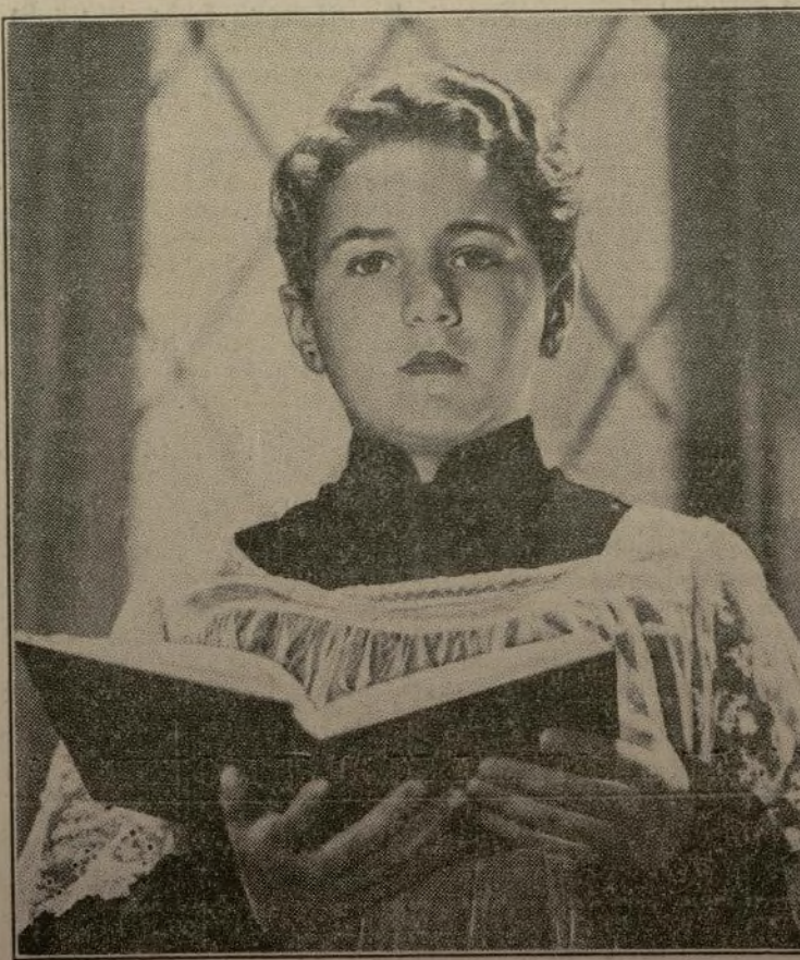
Bobby Breen, niño-estrella del cinematógrafo, quien aparece en la película "Rainbow on the River", la cual empezará a presentarse en el Music Hall en el día de mañana. El también aparecerá en persona en la revista que será presentada.