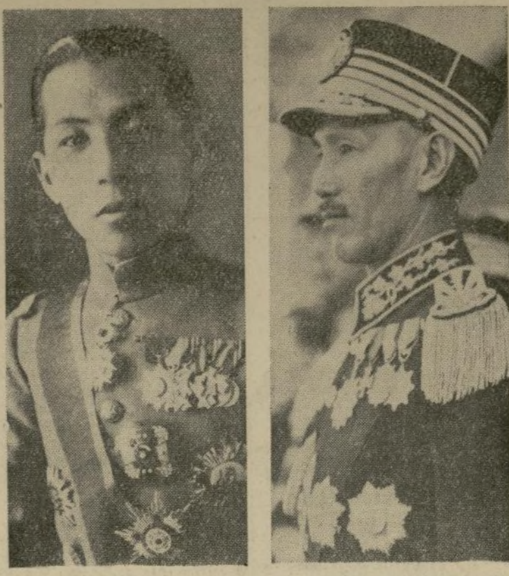
El mariscal Chang Hsueh-Liang, el cual acaba de anunciar el fusilamiento del general Chiang Kai-Shek (derecha) jefe del gobierno central de Nanking que fué capturado el sábado en Sianfu, capital de la Provincia de Shensi. Después de la revuelta, el mariscal Chang exigió que se declarara guerra inmediatamente al Japón.

El mariscal Chang Hsueh-Liang, jefe rebelde, anunció por radio la ejecución. — Varios generales importantes fueron fusilados también. — Gran consternación en China. — El gobierno de Nanking declara ley marcial en todo el país.