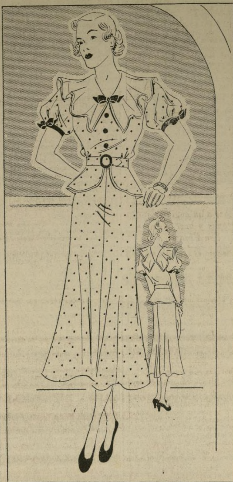
1209-B VESTIDO PARA FIESTA CON CUELLO GRANDE Y ACANALADO

1209-B.—El modelo que hoy se presenta en nuestra página está diseñado con el fin de que sienta bien a todas las figuras desde las que usan la sisa 14 hasta 42.