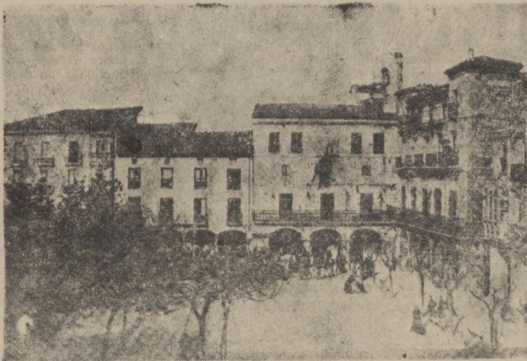
C. R. O. U. N. A.—Casa Consistorial en la plaza de los Fueros Ayuntamiento de Madrid