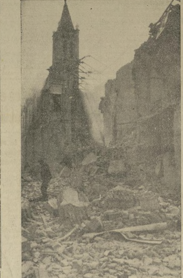
Una calle de Madrid cubierta de escombros, de una iglesia y de una hilera de casas, destrozada, por una bomba arrojada por un avión rebelde.