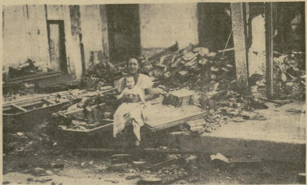
Una madre y su hijo sentados en las ruinas de lo que fue su casa, después que el reciente ciclón devastara a Cienfuegos dejando muchos muertos y centenares de heridos tras él. Cálculase que alrededor de mil casas fueron totalmente destruidas por el viento que alcanzó una velocidad de 150 millas por hora.