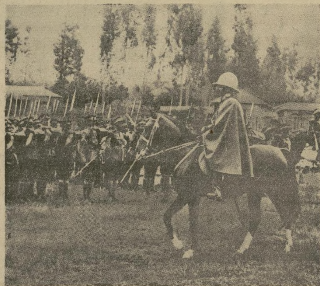
Haile Selassie, Emperador de Abisinia, inspeccionando un regimiento de tropas escogidas, completamente equipadas a la moderna. Selassie, cuya sinceridad y amor a su patria le han ganado la simpatía del mundo, manifiesta que se propone ponerse al frente de las tropas que tratarán de contener la invasión italiana.

EL EMPERADOR SE PONDRÁ AL FRENTE DE SUS TROPAS