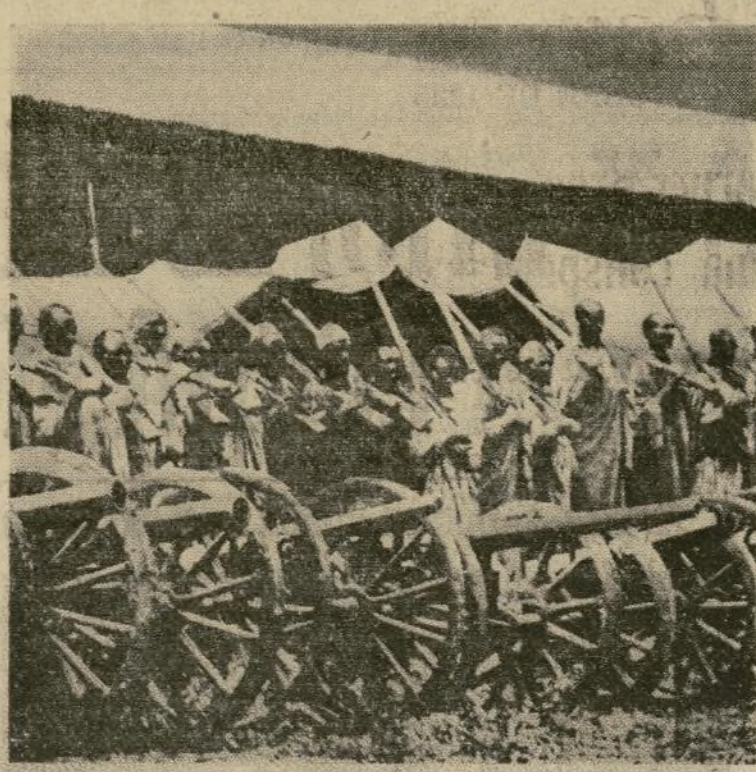
Las tropas abisinias ofrecen curiosos contrastes en cuanto a su equipo bélico. Las piezas de modernísima artillería alternan con los fusiles antiguos, y bajo los pocos aviones con que cuenta el ejército marchan somnolientos caballos africanos y burros, tradicionales medios de transportación.