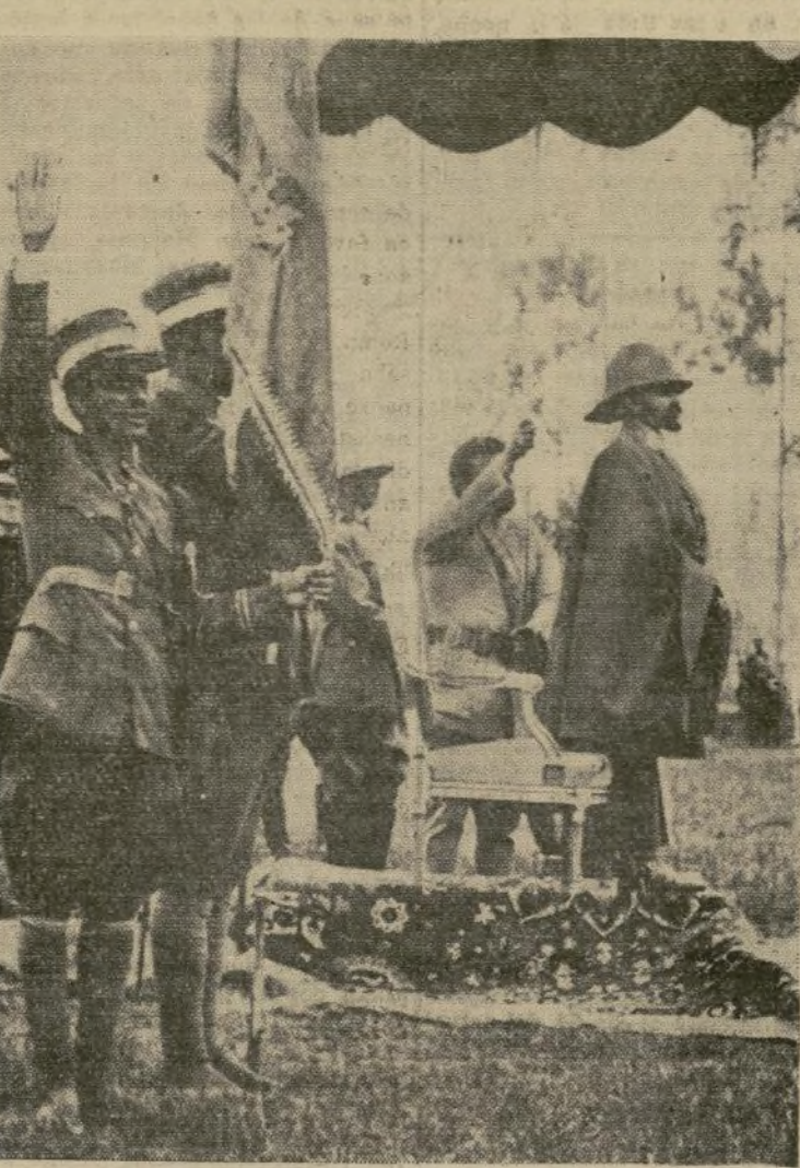
Oficial del ejército abisinio prestando el juramento de fidelidad al emperador Haile Selassie (a la derecha) con "la bandera sagrada de Abisinia" durante una revista militar en Addis Ababa.