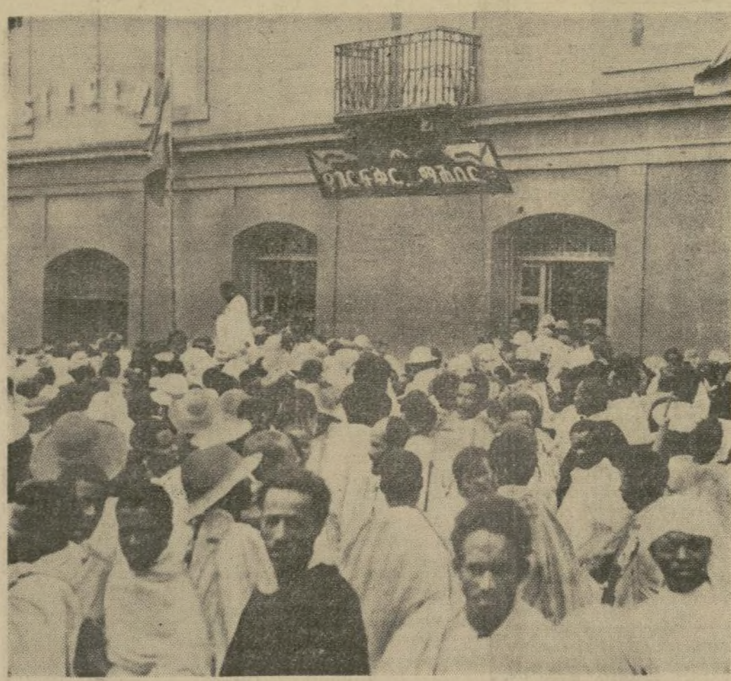
Una reunión patriótica frente al edificio de la Unión de Patriotas en Addis Ababa poco antes de proclamar el emperador Haile Selassie la movilización general para detener el avance de los italianos.