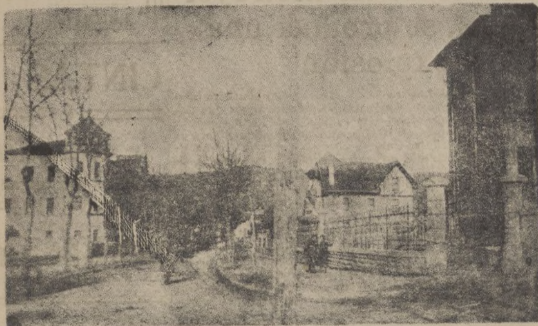
ORDUÑA.—Avenida de la Estación