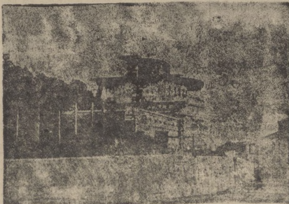
ALGORTA.—Casa Barco Ayuntamiento de Madrid