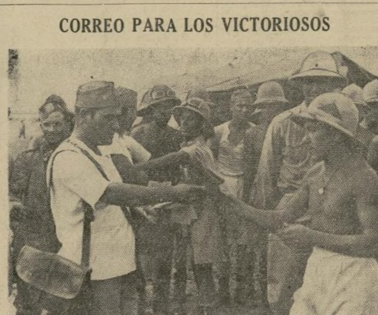
Cartas de Italia llegan a los campos de concentración de las fuerzas fascistas de Mussolini en Africa, donde el calor hace que los soldados abandonen sus uniformes casi enteros reduciendo las prendas al mínimo.

PARIS, octubre 7. (AP) — Francia dio hoy seguridad a Inglaterra de que la prestaria ayuda armada en tierra, aire y mar en caso de que se vea atacada mientras se prepara a poner en vigor las sanciones que dicta la Liga de Naciones, siempre que Inglaterra, a su vez, venga en ayuda de Francia en circunstancias similares.