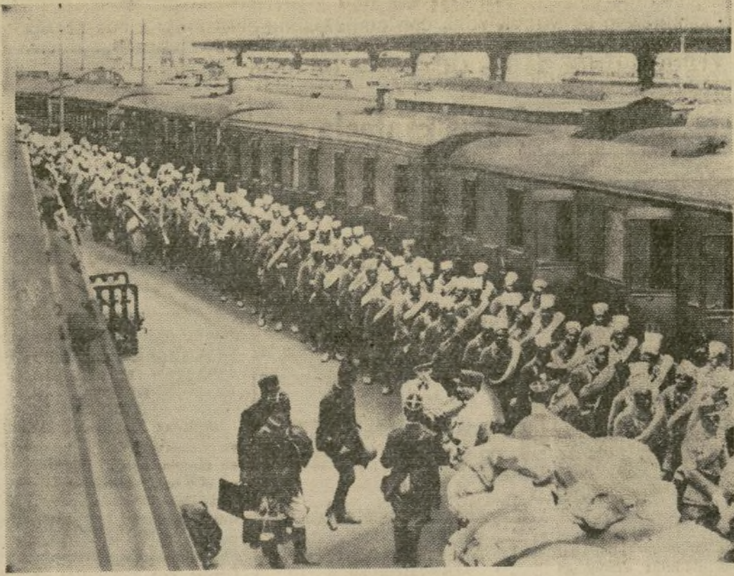
Soldados senegaleses al mando de oficiales franceses, parten de la base naval de Tolón para las colonias en África. La escuadra inglesa, en caso de hostilidades, podrá también usar Tolón como base.