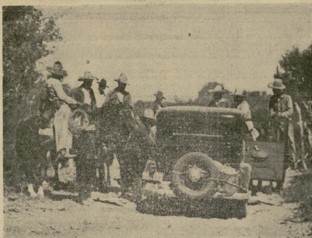
Fotografía tomada por una de las víctimas, Arthur D. Norcross, editor neoyorquino, durante una excursión de cacería en Sonora, en que aparecen rebeldes mejicanos registrando el automóvil en busca de armas y municiones.