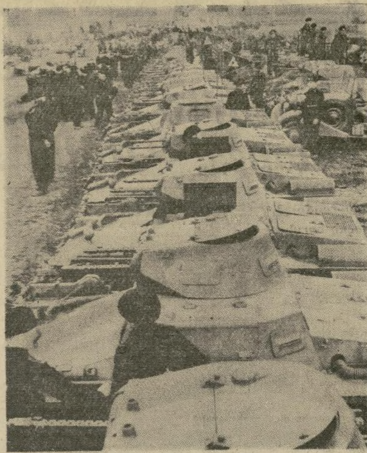
Como parte de la celebración del festival de las cosechas en Bruckberg, cerca de Hameln, Alemania, hubo un gran desfile militar en el que figuraron estos tanques, última adquisición de Hitler en la restauración del ejército a su antiguo poderío.