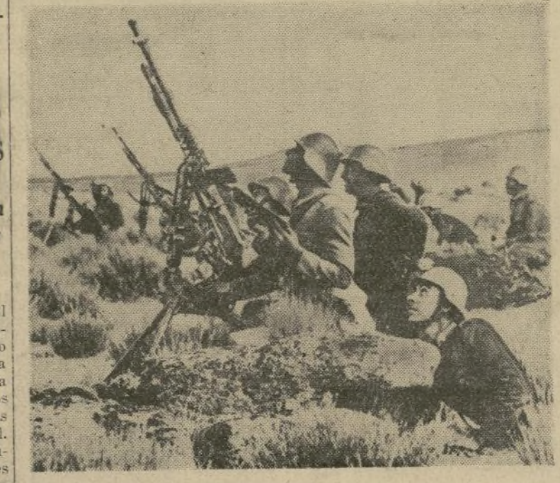
Tiradores antiaéreos en un campo abierto, durante las manio- bras de las fuerzas militares de la república celebradas cerca de Madrid, durante la mayor concentración de tropas que haya presentado jamás el ejército español.