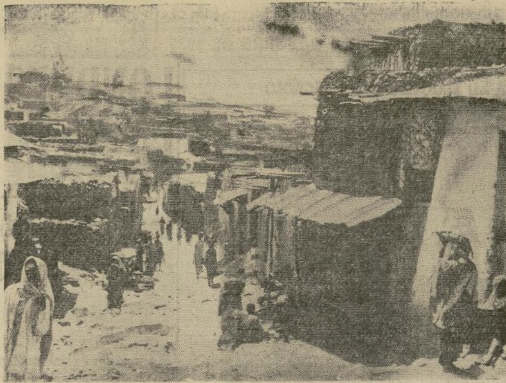
Harar, población abisinia de importancia estratégica y comercial al sur del imperio, en el único ferrocarril que proporciona a Abisinia salida al mar por el puerto francés de Djibouti, será en breve objeto de una poderosa ofensiva de los fascistas, concentrándose ya a sus alrededores.