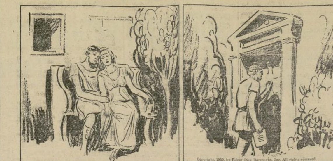
Copyright, 1935, by Edgar Rice Burroughs, Inc. All rights reserved.

En Castra-Sanguinario, los esposales de Diecta, hija de Dion Splendidos, con Praclarus, había excitado románticamente al populacho, condecorado de Diecta había despreciado al hijo del Emperador, despreciando así la oportunidad de algún día llegar a ser Emperatriz, y todo por el amor profundo al joven oficial. El jardín de su casa era escena de los románticos enamorados.