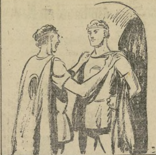
Copyright, 1935, by Edgar Rice Burroughs, Inc. All rights reserved.