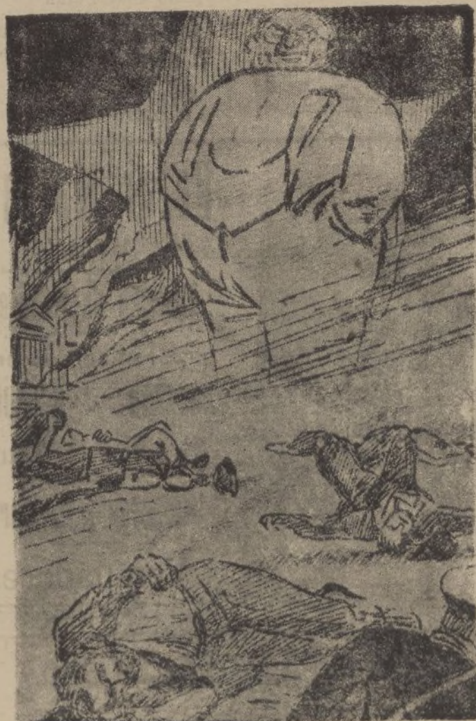
La impulsión soviética en España