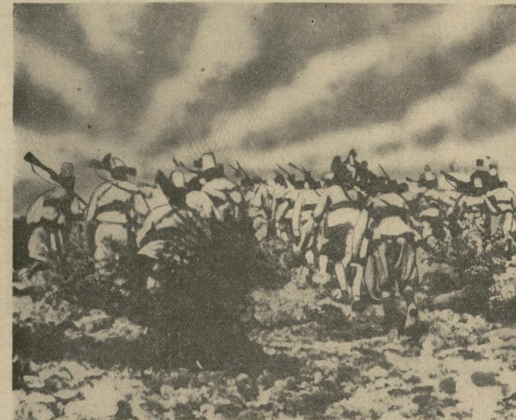
Fotografía oficial mostrando los Askaris de Asmara avanzando hacia una posición ocupada por la artillería fascista en el norte de Abisinia que culminó en la toma de Adua y de la ciudad sagrada de Aksum. Esta última se entregó sin un disparo de cañón.