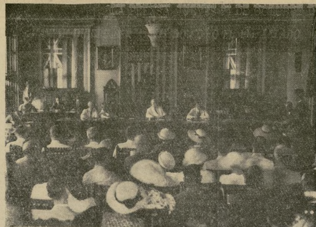
El comité congresal que fué al Hawaii en busca de informaciones para un dictamen que será presentado al congreso con respecto al deseo del territorio hawaiano de ser elevado a la categoría de estado, escucha a un grupo de representantes del Hawaii en una sesión en el capitolio territorial en Honolulu.