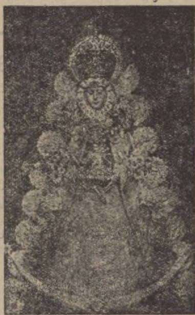
NTRA. SRA. DEL ROCÍO

La nota es un nuevo embuste de Aguirre y sus secuaces.