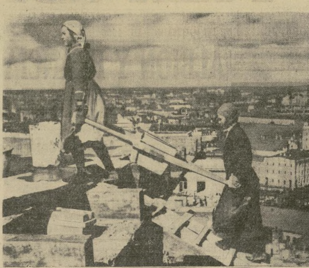
Mujeres ayudantes de albañil trabajando en la construcción del Hotel Moscoviet que será el edificio más alto de Moscú y que es parte del vasto programa de modernización de la capital de la república soviética.