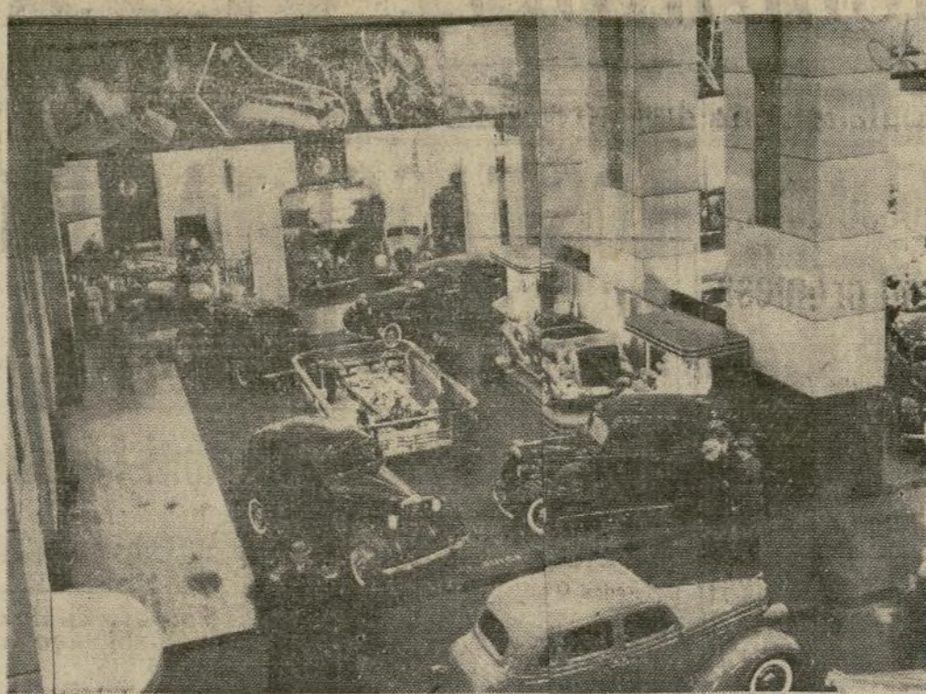
He aquí unos cuantos de entre los 300 y pico de modelos nuevos que se hallan a la vista en la Exposición Nacional de Automóviles en el Grand Central Palace. La exposición ha tenido lugar más temprano que de costumbre por creerse que el trabajo de invierno en los pedidos de carros nuevos ayudará a dar mayor permanencia a los empleos durante el año.