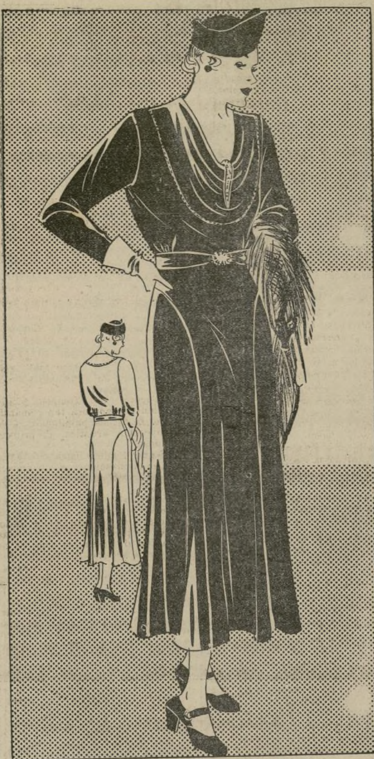
ELEGANTE MODELO PARA MATRONA

1767-B. — La dama de silueta gruesa requiere ciertas cualidades en su ropa. Sus trajes deben ser de líneas sencillas, de estilo discreto y a la vez elegante. Estos deben reunir los detalles de última novedad sin sacrificar esa cierta discreción que sienta tan bien a las señoras de edad mediana. El saber vestir con gusto requiere cierta experiencia y la matrona la tiene, por cuyo motivo ella sabe ya lo que mejor sienta a su figura. Comprende la línea que elimina los defectos de su figura y saca a relucir los más atractivos. También sabe qué colores la favorecen más y se adapta a ellos. No compra un traje por el mero hecho de que es elegante, sino que más bien escoge lo que sienta mejor a su tipo. El modelo que ilustramos reúne todas las buenas cualidades mencionadas. El escote está muy graciosamente decorado y además, luce un "fagoting" hecho a mano que