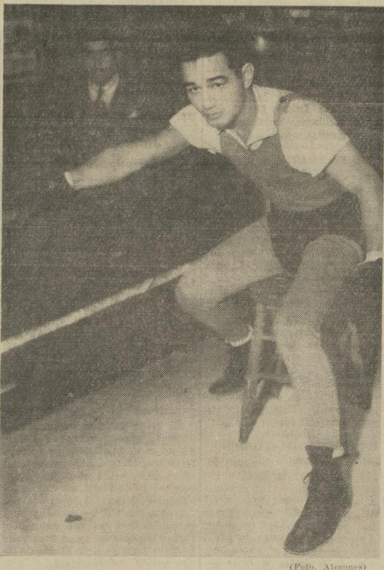
Sixto Escobar en su característica actitud de salida de su esquina para un combate, exactamente como lo va a ver esta noche el campeón en el Garden.