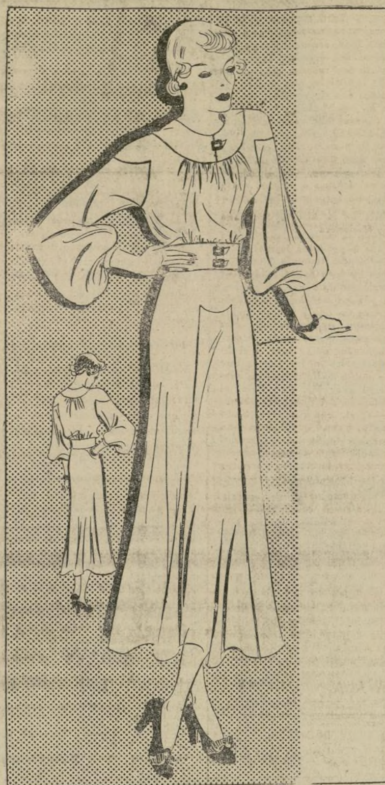
ELEGANTE VESTIDO CON FRUNCIDOS EN LA BLUSA

1711-B.—Los nuevos vestidos de última novedad reúnen varios detalles interesantes en las blusas. Las faldas, por lo regular, son de línea recta o con un vuelo ligero en la parte posterior o frente. Sin embargo, las blusas se hacen destacar por mangas de efecto dramático, cinturones anchos, casi siempre muy ornamentales, y el efecto es de una silueta ensanchada en los hombros, recta y angosta de la cintura para abajo.