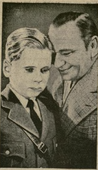
Wallace Beery y Jackie Cooper quienes aparecen desempeñando el papel de padre e hijo en la película "O'Shaughnessy's Boy", que se empieza a exhibir hoy en el teatro Jewel.