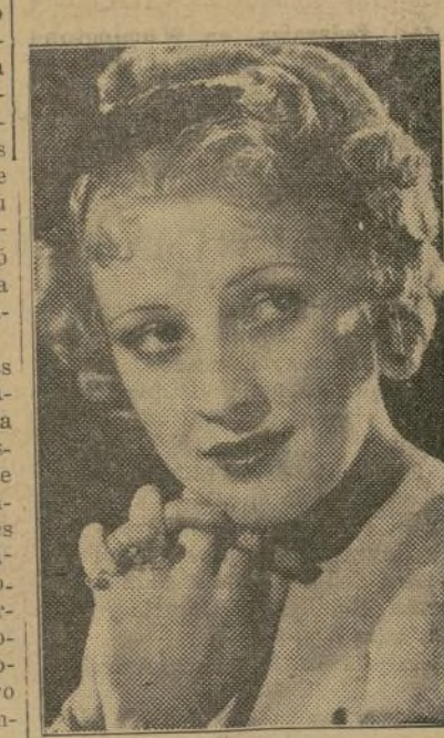
MARGOT GRAHAME Estrella RKO-Radio, está más bella que nunca en "The Three Musketeers"

No importa lo fuerte que tenga que trabajar la estrella del cine, siempre tiene que verse bonita. Por eso es que tantas de ellas beben leche. Ella les da energía, las mantiene chispeantes... sin añadir una onza de peso a sus cuerpos perfectos.