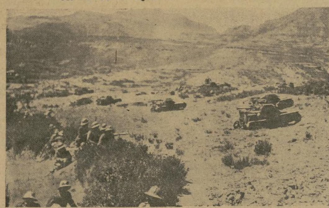
Una de las armas más formidables del ejército italiano que lucha en Abissinia es el "tanque miniatura", que avanza inextinguible por entre la maleza en un territorio donde el enemigo, perfectamente familiarizado con la topografía, desaparece a veces como por encanto. Esta fotografía fue tomada en un avance italiano más allá de Adigrat, ciudad que se entregó a las fuerzas invasoras sin prácticamente derramamiento alguno de sangre.