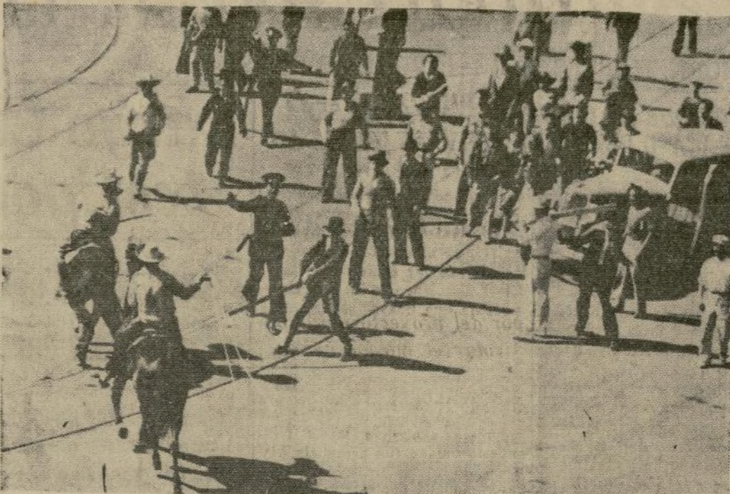
Un charro se prepara a lanzar su reata cuando la policía entraba en acción en una calle de la capital de México durante los desórdenes ocurridos en un desfile en celebración del XXV aniversario de la revolución mexicana. En el encuentro entre trabajadores organizados y miembros de la organización fascista de "Camisas Doradas" resultaron cuatro muertos y treinticuatro heridos.

El doctor E. Gruening tuvo una conferencia ayer con el presidente (Continuación de la primera página) logrados en cuanto al plan de rehabilitación para la isla de Puerto Rico. El doctor Gruening espera regresar a la isla dentro de una semana o diez días.