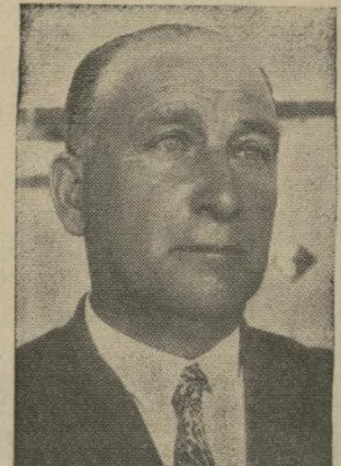
Don Francisco Largo Caballero