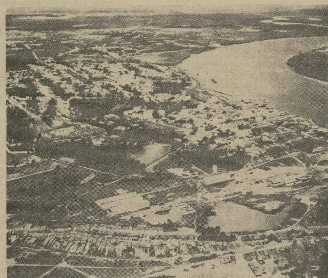
Vista aérea del importante puerto marítimo de Natal, una de las dos ciudades que se dice fueron tomadas por comunistas y regimientos amotinados, al empezar el movimiento revolucionario en cuatro estados del noreste y uno en el sureste.