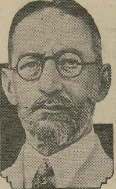
General Mario G. Menocal