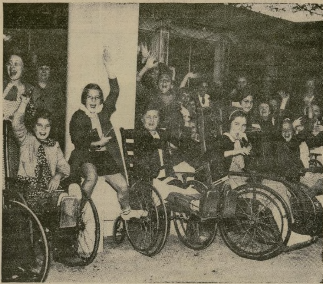
Los jóvenes pacientes de la Warm Springs Foundation, en Georgia, que el presidente Roosevelt estableció para ayudar a la rehabilitación de enfermos de parálisis infantil, aclaman a presidente a su llegada en visita anual del Día de Gracias.