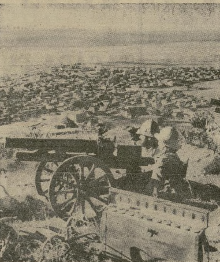
Los artilleros de Mussolini, después de la captura de Makale, apuntan ahora sus cañones a la ciudad desde el fuerte Enda Jesus, construido para el uso de la expedición que terminó de manera tan desastrosa en 1896.