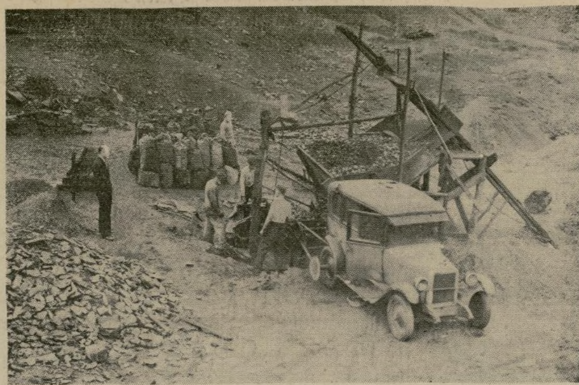
Uno de los miles de improvisados trabajos mineros en Pennsylvania, por medio de los cuales, según declaran los dueños de los yacimientos, 3,000,000 de toneladas de carbón son sacadas ilegalmente cada año. Una de las ruedas traseras de un automóvil proporciona la fuerza para mover el elevador. Al llegar a la superficie, el carbón es ensacado por los trabajadores y embarcado directamente al lugar de su destino.