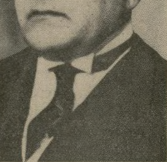
Presidente Getulio Vargas.

Témese que estas fuerzas tengan que luchar contra las tropas de Shang Chen